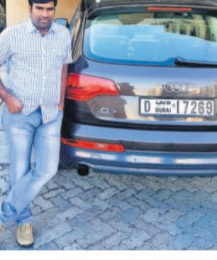
తర్వాత తాను అమెరికా నుంచి వస్తున్నాను.. అని చెప్పి.. ఓ రోజు బాధితురాలికి ఇంటికి వెళ్లారు. తన మాయమౌతూ బాధితురాలిని, ఆమె కుటుంబ సభ్యులను సమ్మించి ఒప్పించాడు. కొద్ది రోజుల తర్వాత ఈ పిండ్లికి తన కుటుంబ సభ్యులు ఒప్పుకోవడం లేదని, నాకు వారు అవసరం లేదు.. నీతోనే నా పెండ్లి ఉంటూ సమ్మించాడు. అంతేకాక.. ఇష్టం లేని పెండ్లి చేసుకుంటున్నానంటూ నా కుటుంబ సభ్యులు తన మొత్తం బ్యాంకు ఖాతాలను ఫ్రీజ్ చేశారని, అల్లికంగా సహకరించాలని, అమెరికా వెళ్లిన తర్వాత మొత్తం డబ్బు తిరిగి ఇస్తానంటూ సమ్మించి, బాధితురాలి కుటుంబం నుంచి రూ.1.8 కోట్లు కాజీనిస్తూ, కరోనా సమయంలో బాధితురాలి కూతురు అన్నత్రీలో చేరగా.. అన్నత్రీ ఖర్చుల కోసం కొంత డబ్బు ఇచ్చానని కోరగా.. చేతులెత్తాకూ విస్వారి మరణించింది. ఆ తర్వాత నిందితుడు కనిపించకుండా పోయాడు. ఇదంతా మోసమని గుర్తించిన బాధితురాలు.. ఆ తన డిని వెతకడం మొదలుపెట్టింది. ఎక్కడా అతడి ఆచూకీ తెలియకపోవడంతో సైబర్ క్రిమి పోలీసులకు ఫిర్యాదు చేశారు. కేసు నమోదు చేసి, దర్యాప్తు చేపట్టిన పీఏసీ రిపోర్టులపై నేతృత్వంలో ఇన్స్పెక్టర్ ఎన్.రమేష్ బిర్బాడం.. నిందితుడిని అరెస్టు చేసింది. అతడి వద్ద నుంచి షాద్దు, క్యూబుక్ అధికారులకు సంబంధించిన నకిలీ ఐడ్లు స్వాధీనం చేసుకున్నారు.