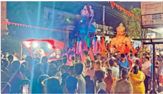
తాండూరు: హనుమాన్ శోభాయాత్ర

• దేవాలయాల్లో ప్రత్యేక పూజలు, అన్నదాన కార్యక్రమాలు • వైభవంగా శోభాయాత్ర • పాల్గొన్న ప్రజాప్రతినిధులు