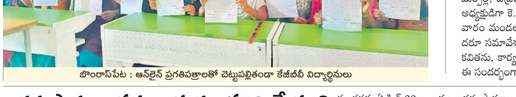
బొంబాయి: ఆన్లైన్ ప్రగతిపత్రాలతో చెట్టుపల్లితండా కేజీబీ విద్యార్థులు

పెద్దఅంబరపేట : ప్రభుత్వ పాఠశాలలకు మంగళవారం వివరించిన మేరకు పనులు పూర్తి చేసింది. బుధవారం నుంచి ప్రభుత్వం వేసవి సెలవులు ప్రకటించింది. పరీక్షలు రాసిన విద్యార్థులకు ఉపాధ్యాయులు ప్రోగ్రెస్ కార్డులు అందించారు. పాఠశాలల్లో తల్లిదండ్రులు, ఉపాధ్యాయులు సమావేశాలు నిర్వహించారు.