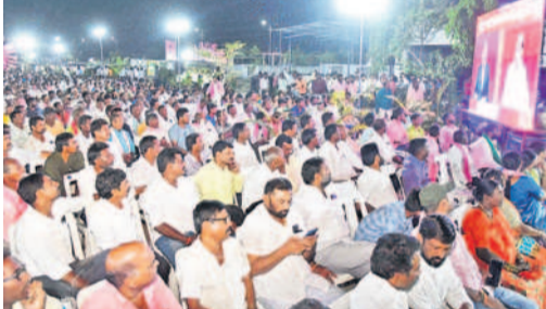
హనుమకొండలో భారీ సమీక్షలు కేటీఆర్ లైవ్ ఇంటర్వ్యూ మాన్యుస్క్రిప్ట్ కార్యక్రమం, అభిమానులు