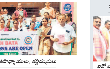
'బడిటా' రాల్చిని ప్రారంభిస్తున్న ఉపాధ్యాయులు, తల్లిదండ్రులు