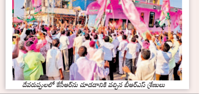
దేవరపల్లెలో కేసీఆర్ ను చూడడానికి వచ్చిన బీఆర్ఎస్ శ్రేణులు