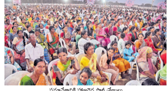
సమావేశానికి హాజరైన పార్టీ శ్రేణులు