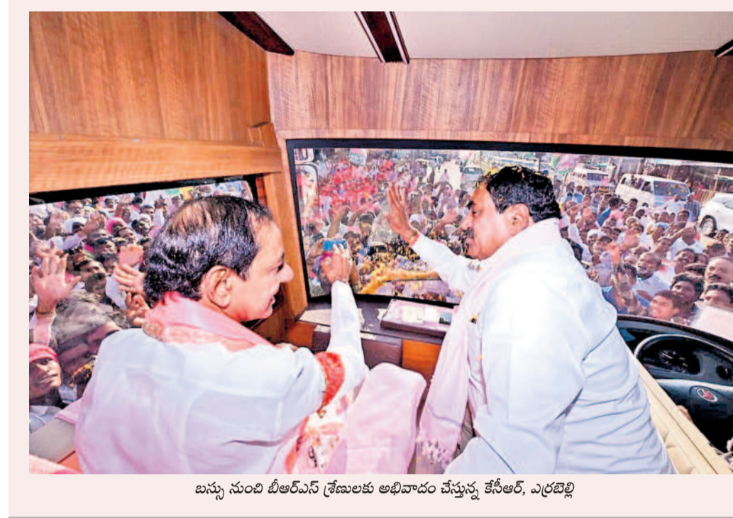
బస్సు నుంచి బీఆర్ఎస్ శ్రేణులకు అభివాదం చేస్తున్న కేసీఆర్, ఎర్రబెల్లి