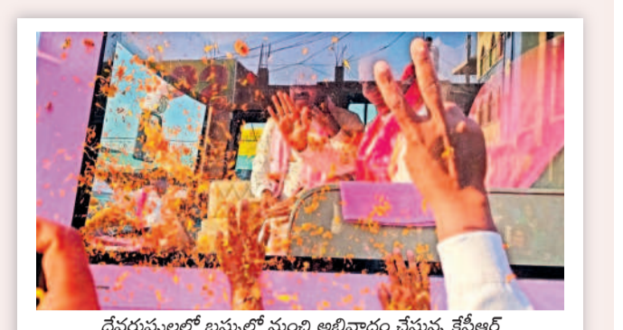
దేవరపల్లెలో బస్సులో నుంచి అభివాదం చేస్తున్న కేసీఆర్

దేవరపల్లె, ఏప్రిల్ 25 : జనగామ జిల్లా దేవరపల్లె మండల కేంద్రానికి గురువారం వచ్చిన మాజీ ముఖ్యమంత్రి, బీఆర్ఎస్ అధినేత కేసీఆర్ కు స్వాగతం పలికారు. వందలాది మంది తమ అభిమాన నాయకుడి కోసం గంటల కొద్దీ ఎదురు చూసి బస్సు రాగానే పూల వర్షం కురిపించారు. యాదాద్రి భువనగిరిలో రోడ్ షాకు దేవరపల్లె మీదుగా బస్సులో కేసీఆర్ వెళ్తున్నారని సమాచారంతో మండల కేంద్రంలోని జాతీయ రహదారిపై మాజీ మంత్రి ఎర్రబెల్లి దయాకరరావుతోపాటు వందలాది నాయకులు, కార్యకర్తలు చేరుకొని కేసీఆర్ కు భారీ స్వాగతం పలికారు. బస్సుకు అడ్డుపడి కేసీఆర్ ను చూసేందుకు ఎగబడ్డారు. మహిళా కార్యకర్తలు ఆయనపై పూల వర్షం కురిపించారు. బస్ ఆర్డం పట్టకు పోయి చెయి ఊపుతూ అభివాదం చేశారు. దీంతో కేసీఆర్ అడ్డానికి చేయి ఆనించి కరచాలనం చేశారు. మాజీ మంత్రి ఎర్రబెల్లిని గమనించిన కేసీఆర్ నవ్వుతూ బస్సుకొరతల సైన్ చేశారు. దీంతో బస్సుకొరతల ఎర్రబెల్లి కేసీఆర్ పక్కన కూర్చుని ప్రజలకు అభివాదం చేశారు. గంట వ్యవధిలో ఇంత మంది రావడంపై ఎర్రబెల్లిని కేసీఆర్ అభినందించినట్లు తెలిసింది. 10 నిమిషాల పాటు ఆగిన కేసీఆర్ బస్సు కదలడంతో రోడ్డు క్లియర్ అయింది.