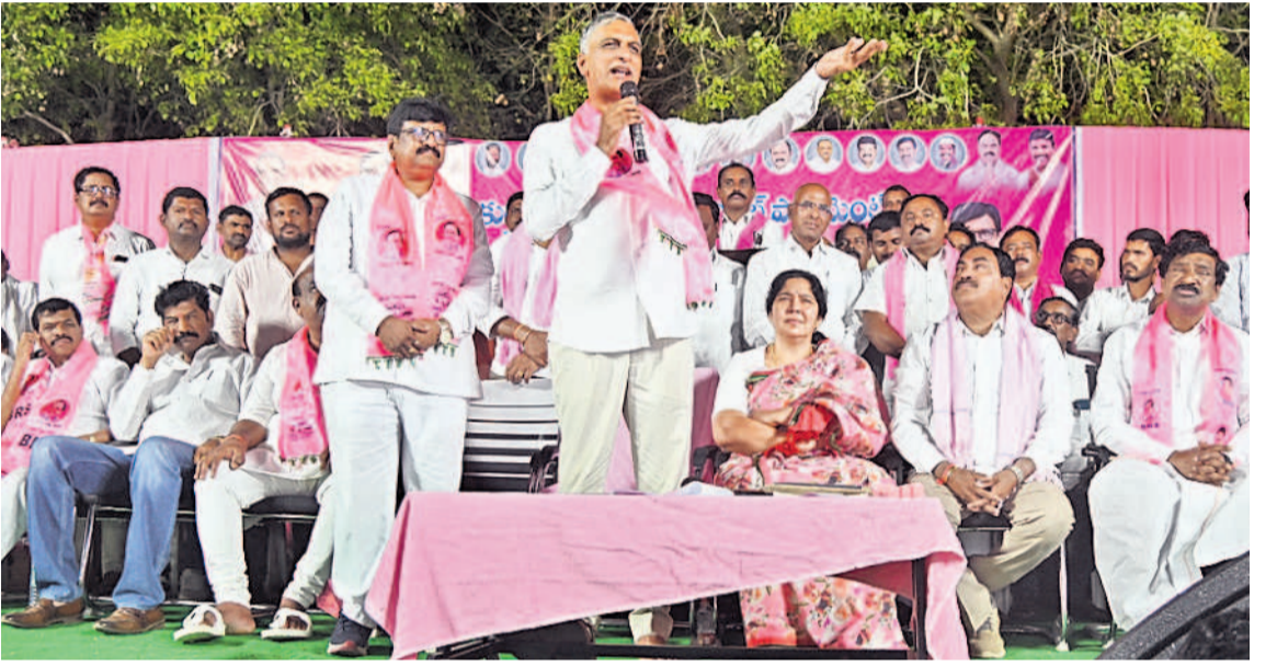
సమావేశానికి హాజరైన పార్టీ శ్రేణులు

మోసపూరిత హామీలు ఇచ్చి అధికారంలోకి వచ్చిన కాంగ్రెస్ ప్రభుత్వానికి బుద్ధి చెప్పాలంటే తనను గెలిపించాలి. వరంగల్ పార్లమెంట్ అభివృద్ధికి కృషి చేస్తా. రుణమాఫీ అత్యంత కాంగ్రెసుకు ఓట్లు వేసిన రైతులు ఇప్పుడు నష్టపోయామని బాధపడుతున్నారు. ఒకవైపు పంటలు పండకే మరోవైపు పండించిన ధాన్యానికి మద్దతు ధర లేక తీవ్రంగా నష్టపోయిన రైతులు ఇప్పుడు కేసీఆర్ కు మైత్రు చూస్తున్నారు.