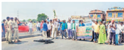
ఊరుగోడ వద్ద రోడ్డుపై ధర్నా చేస్తున్న రైతులు

దామెర, ఏప్రిల్ 25 : విజయవాడ-నాగపూర్ గ్రీన్ ఫీల్డ్ ఎక్స్ ప్రెస్ హైవే నిర్మాణాన్ని వ్యతిరేకిస్తూ గురువారం రైతులు ధర్నాకు దిగారు. మొగ్గలపల్లి, గడ్లకాని పల్లి, రంగాపురం, సీతారాంపురం, దుర్గంపేట, వెల్లంపల్లి, పులుకుర్తి, ఊరుగోడ గ్రామాలకు చెందిన రైతులు ఊరుగోడ-పరంగండ్ల క్రాస్ వద్ద కేంద్ర ప్రభుత్వ తీరును నిరసనగా ధర్నాకు దిగారు. దీంతో జాతీయ రహదారిపై ఎక్కడి వాహనాలు అక్కడి నిలిచిపోయాయి. విషయం తెలుసుకున్న పోలీసులు అక్కడికి చేరుకుని రైతులను రోడ్డు పక్కకు తప్పించేందుకు యత్నించారు.