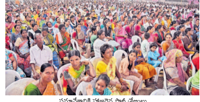
సమావేశానికి హాజరైన పార్టీ శ్రేణులు