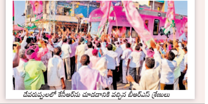
దేవరపల్లెలో కేసీఆర్ ను చూడడానికి వచ్చిన బీఆర్ఎస్ శ్రేణులు