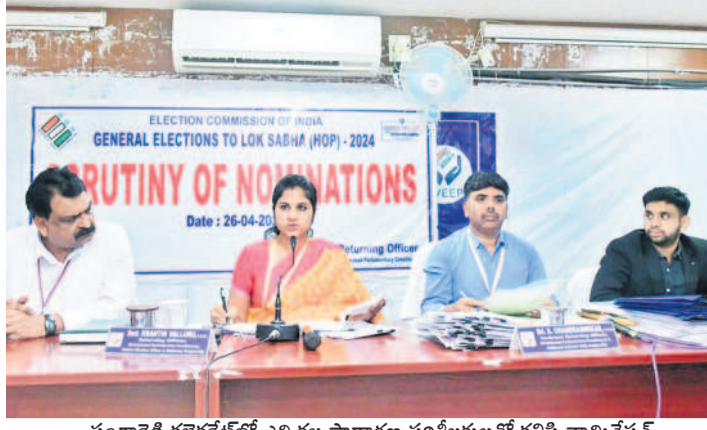
సంగారెడ్డి కలెక్టరేట్లో ఎన్నికల సాధారణ పరిశీలనలతో కలిసి నామినేషన్ పత్రాలను స్వీకరించే సమయంలో అధికారి పలుకుతున్న ప్రసంగాలు