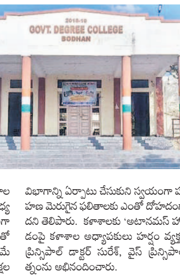
విభాగాన్ని ఏర్పాటు చేసుకుని స్వయంగా పరీక్షల నిర్వహణ మొదలుపెట్టిన బోధన్ కళాశాలకు ఎంతో దోహదంగా ఉంది