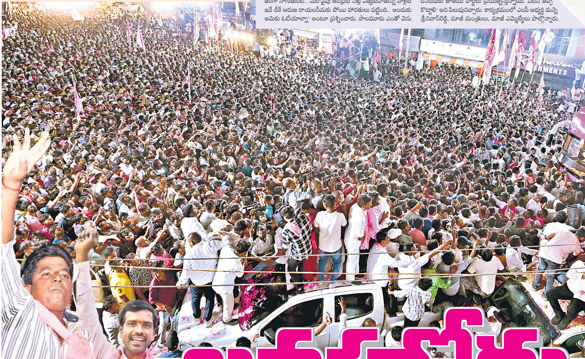
క్లాక్ టవర్ వద్ద నిర్వహించిన కార్నర్ మీటింగ్ కు వేలాదిగా తరలివచ్చిన బీఆర్ఎస్ నేతలు, అభిమానులు

I హైదరాబాద్, శనివారం 27 ఏప్రిల్ 2024 RANGAREDDY