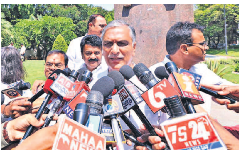
కోసం వారి పట్ల ఏ విధంగా వ్యవహరించాలి? హామీ ఇచ్చినట్లు మొత్తం రూ.2 లక్షల రద్దు చేస్తారు? లేదంటే ఎక్కడానికీ ఇంత అన్న పరిమితి విధిస్తారు? ఇవన్నీ తేలాలి. సహకార సంఘాలు, గ్రామీణ బ్యాంకుల నుంచి కూడా సహకారం తెప్పించుకోవాలి. ఇందుకోసం వ్యవసాయ శాఖలో, ఆర్థిక శాఖలో ఒక సర్క్యూల్ గానీ, ఆర్డర్ గానీ పంపించి ఉంటే ఈ పాటికే కొంత స్పష్టత ఉండేది. రుణమాఫీ కొత్తగా జరుగుతున్నదేమీ కాదు. గత బీఆర్ఎస్ ప్రభుత్వం చేసిన అందులో ఉన్న ఇబ్బందులను అధికారంలోకి వచ్చింది. ఇతర రాష్ట్రాల్లో కూడా గతంలో అమలుచేసిన అక్కడి అనుభవాలేమిటి? ఎందుకైనా సమస్యలను ఏ విధంగా పరిష్కరించుకున్నాడు? ఇలాంటి సమాచారం అంతా సేకరించాలి. మ్యాన్యూవల్లోని అంశం కాబట్టి ప్రజా ప్రతినిధులు, పార్టీ శ్రేణులు అభిప్రాయాలను తెలుసుకోవాలి. ఇదంతా జరిగి ఉంటే రుణమాఫీపై మార్గదర్శకాలు ఇప్పటికే సిద్ధమై ఉండేవి. ప్రభుత్వం ప్రయత్నాలు ప్రారంభించిందన్న సమస్యం రైతుల్లో కలిగి ఉండేది. ఇవే జరగడం లేదన్నది హరిశ్చంద్ర ఆవేదన.

రాజీనామా పత్రం అంటూ అమర వీరు సాక్షిగా తెలిపారు. ఇది రాష్ట్రంలో సంఘటన కలిగింది. దీనిపై అధికారపక్షం విమర్శలు, వ్యాఖ్యానాలు, సవాళ్ల చేస్తున్నది. కాంగ్రెస్ ఇచ్చిన ఆరు గ్యాంబులు, 18 హామీలను స్వాతంత్ర్య దినోత్సవం నాటికి అమలు చేయలేదని, ఒక వేళ చేస్తే ఎమ్మెల్యే పదవికి రాజీనామా చేస్తానని ప్రసారం చేశారు. రాజీనామా పత్రం అంటూ అమర వీరు సాక్షిగా తెలిపారు. ఇది రాష్ట్రంలో సంఘటన కలిగింది. దీనిపై అధికారపక్షం విమర్శలు, వ్యాఖ్యానాలు, సవాళ్ల చేస్తున్నది. కాంగ్రెస్ ఇచ్చిన ఆరు గ్యాంబులు, 18 హామీలను స్వాతంత్ర్య దినోత్సవం నాటికి అమలు చేయలేదని, ఒక వేళ చేస్తే ఎమ్మెల్యే పదవికి రాజీనామా చేస్తానని ప్రసారం చేశారు.