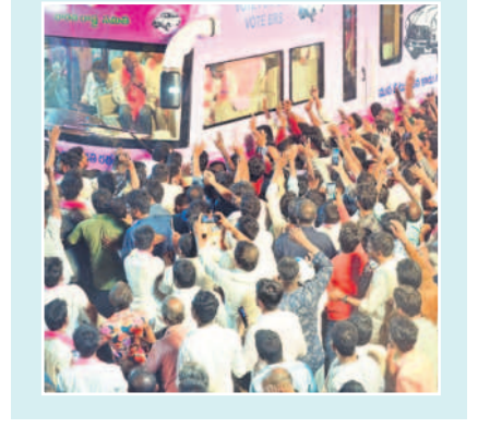
- న.వీ.కె.మార్, నాగర్ కర్నూల్, ఏప్రిల్ 27

కందనూలు కందనూలు.. అఖిమానం ఉప్పొంగింది.. పల్లెలన్నీ కదిలాయి.. ప్రజలు తరలిచ్చారు.. జనం చేతుల్లో గులాబీ జెండాలు రెపరెపలాడాయి.. జై తెలంగాణ నిన్నాడూలు మనసంటాయి.. ధారులన్నీ గులాబీమయం అయ్యాయి.. పటాకుల మోతలు హోరెత్తాయి.. జై కేసీఆర్, జై జై బీఆర్ఎస్ నిన్నాడూలు మార్చేయాలి.. ఉయ్యాలవాడ నుంచి మొదలైన బీఆర్ఎస్ రోడ్ షోకు ప్రజలు నీరాజనం పలికారు.. దారిపాద పునా మహిళలు మంగళ హారతులు పట్టారు.. అఖిమాన నేత, గులాబీ దశ ప తిని కనులారా చూసేందుకు ప్రజలు వేలాదిగా తరలిరాగా పట్టణం జనం వచ్చింది.. బస్టాండ్ వద్ద జరిగిన కార్వర్ మీటింగ్ లో గులాబీ బాన్ ప్రసంగానికి జై కొట్టారు.. ప్రజలు ఫిదా అయిపోయి ఈ లలు, చప్పట్లతో మద్దతు తెలిపారు.. అఖి నేత దిశానిర్దేశంతో క్యాండల్ సూతనో త్రేణం నిండింది.. పాలమూరు, నాగర్ కర్నూల్ పార్లమెంట్ సెంటర్లలో జరిగిన బస్సు యాత్ర బిగ్గెయంగా ముగిసింది.