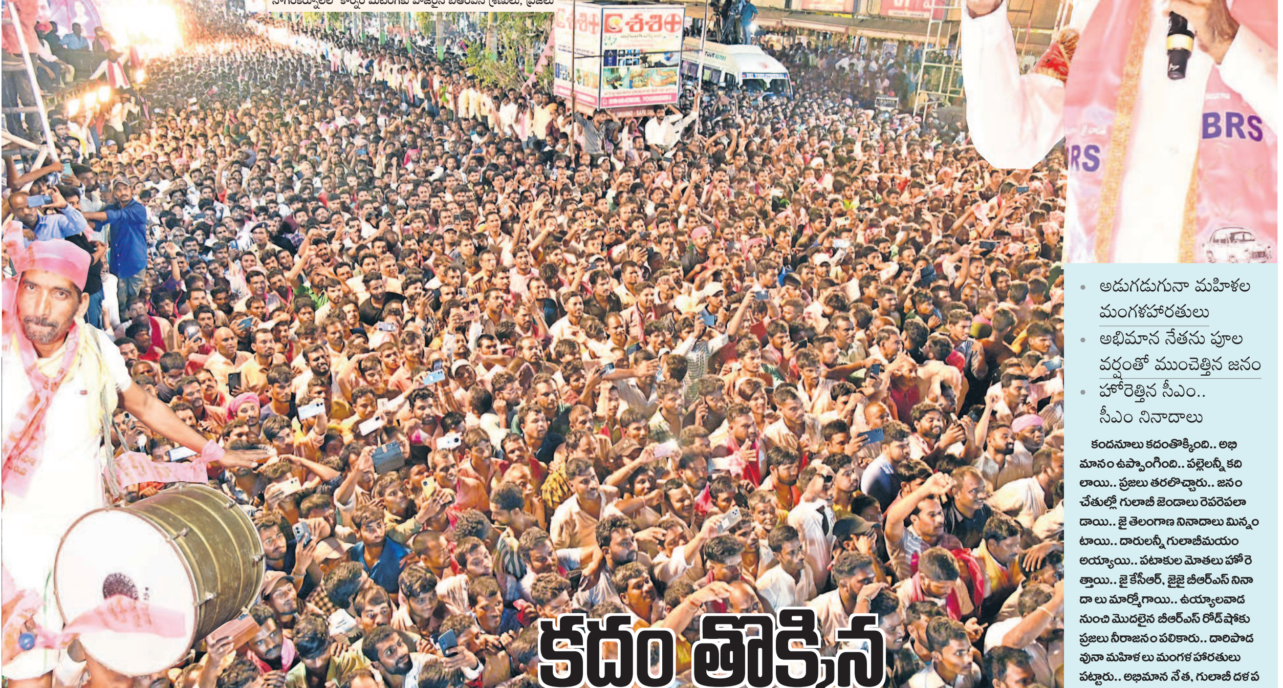
నాగర్ కర్నూల్ లో కార్వర్ మీటింగ్ కు హాజరైన బీఆర్ఎస్ శ్రేణులు, ప్రజలు

• జనవాహినిని తలపించిన కేసీఆర్ బస్సుయాత్ర • మూడు కిలోమీటర్ల పొడవునా ఘన స్వాగతం • డప్పులు, పేర్ బ్యాండ్, డీజేలతో హోరెత్తించిన శ్రేణులు