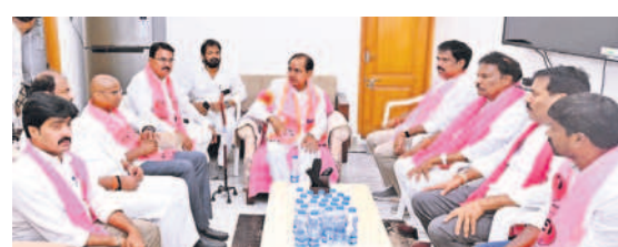
నాగర్ కర్నూల్ సమీక్షలో మాట్లాడుతున్న బీఆర్ఎస్ అధినేత కేసీఆర్, చిత్రంలో ఆర్ఎస్, మాజీ మంత్రిలు, ఎమ్మెల్యేలు, మాజీ ఎమ్మెల్యేలు