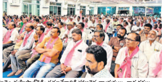
సమావేశానికి హాజరైన నాయకులు, కార్యకర్తలు