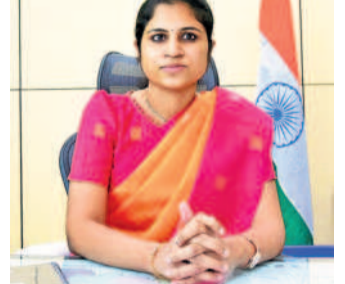
కల నిర్వహణ కోసం నియమించిన పోలింగ్ అధికారులు, సహాయ పోలింగ్ అధికారులు, ఇతర ఎన్నికల సిబ్బందికి మే 1, 2, 7, 8 తేదీల్లో వారికి కేటాయించబడే అసెంబ్లీ

నియోజకవర్గ కేంద్రాల్లో శిక్షణ కార్యక్రమాలు రెండు విడతల్లో ఏర్పాటు చేయనున్నట్లు వెల్లడించారు. ఎన్నికల విధులు కేటాయించిన ఉద్యోగులందరూ విధిగా శిక్షణ కార్యక్రమాలు అనుభవించాలని ఆమె సూచించారు. ఉదయం 10 గంటల నుంచి సాయంత్రం 5 గంటల వరకు శిక్షణ కార్యక్రమం నిర్వహించనున్నట్లు పేర్కొన్నారు. ఈనెల 28న ఆదివారం స్టానిక పీఎస్ గార్డెన్లో ఈవిధమైన శిక్షణ ఉదయం 7 గంటలకు ఏకాగ్రలు, ఆర్కేలు, సెక్యూరిటీ అధికారులకు, ఏఎల్ఎంబీలు, ఇతర సిబ్బందికి శిక్షణ కార్యక్రమం ఏర్పాటు చేసినట్లు వివరించారు. శిక్షణకు ఆయా అధికారులందరూ విధిగా హాజరుకావాలని ఎన్నికల అధికారి వల్లూరు క్రాంతి సూచించారు.