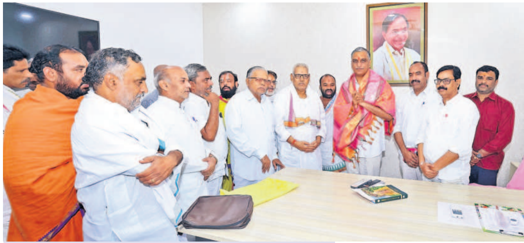
సిద్దిపేటలో ఎమ్మెల్యే హరిశ్చంద్రాచార్యుల సన్మానిస్తున్న బ్రాహ్మణ పరిషత్ సభ్యులు