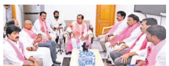
నాగర్ కర్నూల్ సమీకృత మాట్లాడుతున్న బీఆర్ఎస్ అధినేత కేసీఆర్, చిత్రంలో ఆర్ఎస్పీ, మాజీ మంత్రులు, ఎమ్మెల్యేలు, మాజీ ఎమ్మెల్యేలు