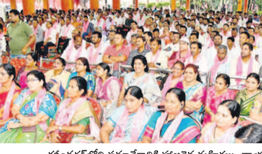
కరీంనగర్లోని సమావేశానికి హాజరైన మహిళలు, నాయకులు, కార్యకర్తలు

తెలంగాణ చౌక్, ఏప్రిల్ 28: జిల్లాలోని యవత అసాంఘిక కార్యకర్తల పాలు, చెడు వ్యవసాయక అలవాటుపడి బంగారంలాంటి భవిష్యత్తును నాశనం చేసుకోవద్దని ఎస్సీ అల్లి లీ మహాజన సూచించారు. ఈ మేరకు శని వారం అర్ధరాత్రి 'అవరేషన్ చలుత్రా' అనే కేజిల్లా వ్యాప్తంగా ముమ్మర తని తీరులను నిర్వహించినట్లు తెలిపారు. తెరరాత్రి వేళల్లో ప్రధాన కూడలు, వీధులు, రోడ్లు, పుణ్యక్షేత్రాలకు గుంపులుగా తిరుగుతూ ప్రజలను ఇబ్బందు లకు గురిచేస్తున్నారన్నారు. మద్దతు తాగి రోడ్లపై వాహనాలతో రాష్ట్రవ్యాప్తం, హాస్టల్ కౌడు తూ అనుమానస్పందంగా తిరుగుతున్న 256 మంది యువకు లను అదుపులోకి తీసుకొని, 81 ద్వితీయ వాహనాలు సీజ్ చేసి కౌన్సిలింగ్ ఇచ్చినట్లు వెల్లడించారు. యవత లక్ష్యంగా ఆరోపణ చలుత్రా పేరుతో తరచూ తనిఖీలు నిర్వహించుతున్నట్లు తెలిపారు. సామాన్యులు, మహిళలకు ఇబ్బంది కలిగిస్తే సేనుల సమాధి చేస్తామని హెచ్చరించారు.