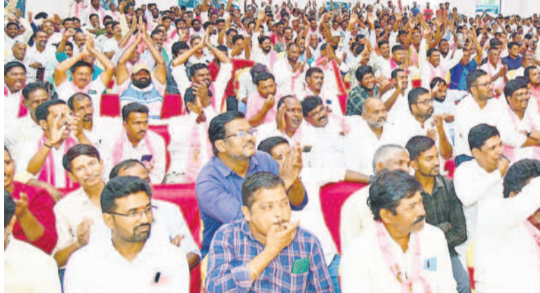
అల్లువూర్లో జరిగిన మానగొండూర్ నియోజక వర్గ బూత్ స్థాయి కమిటీల సమావేశానికి హాజరైన బీఆర్ఎస్ శ్రేణులు

అభ్యర్థులను ఓడించే కుట్రలు పన్నుతున్నారని, దీనిని బీఆర్ఎస్ కార్యకర్తలు అర్థం చేసుకోవాలని సూచించారు. శ్రీరాముడు అందరూడని, దేవుడి పేరు చెప్పి బండి సంజయ్ ఓట్లు అడగడం సిగ్గుచేటు, శ్రీరాము లపై బీఆర్ఎస్ శ్రేణులందరూ ఇంటింటికీ వెళ్లి చచ్చి వెళ్లి బిమ్మతొంగి సమాధానం ఇవ్వాలి. మే13న జరిగి ఎన్నికల్లో కారు గుర్తుకు ఓటు వేసి బీఆర్ఎస్ అభ్యర్థి వినోద్ కుమార్ గెలిపించాలని కోరారు.