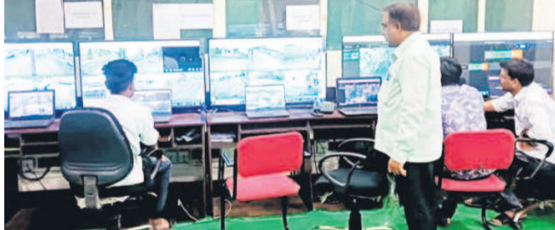
ఆన్లైన్లో వచ్చిన ఫిర్యాదులను పరిశీలిస్తున్న సిబ్బంది

కరీంనగర్ కలెక్టరేట్, ఏప్రిల్ 28 : ఎన్నికలపై పౌరచర్య కంగా నిర్వహించేందుకు ఎన్నికల సంఘం చేస్తున్న కృషి ఫలితం సాధించింది. మూడున్న కాలానికనుగుణంగా ఆరునెలల పాటు ప్రజలకు అనుకూల అవకాశం తెచ్చి, వాటిని క్షేత్రస్థాయికి తీసుకొచ్చడంలో సక్సెస్ అవుతోంది. ప్రస్తుత పరిస్థితుల్లో మనకొంది కు అనుకూల స్థాయి నుంచి కళ్లకు కనిపించిన మరుక్షణాదు అరచేతిలో నుంచే సమాచారం చేరవేలా పౌరచర్య వైతన్య బీజేపీ నాటింది. దీంతో, ఎన్నికల సంఘం నిర్దేశించిన నిబంధనల కింద ఎన్నికల ఫిర్యాదుల వెబ్సైటు మొదలు కాగా, వెబ్సైటు వెబ్సైటు కేసులు కూడా సమాధిచేయడంతో అభ్యర్థుల్లో నిబంధనల గుబులు వెంటాడుతోంది. ఎన్నికల్లో జరిగి అవినీతి, అక్రమాలను అభ్యర్థిచేయడం సామాజిక బాధ్యతగా ప్రచారం చేస్తూ, శ్రమలేకుండా అరచేతి నుంచే ఫిర్యాదు చేసే డిజిటల్ విధానానికి కనీసం శ్రీకారం చుట్టించింది. ఇందులో భాగంగా 1950 కాలెండరింగ్, సీ-విజిల్ యాక్ట్, ఈ-సెవిల్