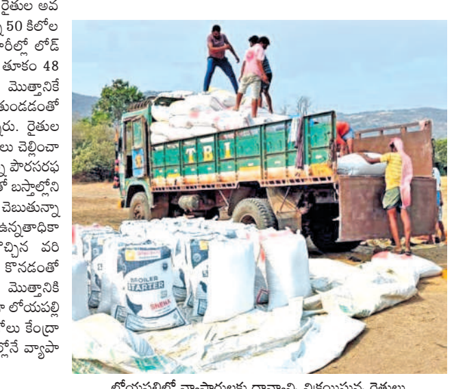
లోయపల్లిలో వ్యాపారులకు ధాన్యాన్ని విక్రమిస్తున్న రైతులు