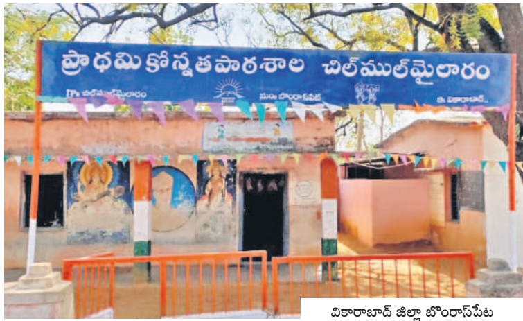
వికారాబాద్ జిల్లా బోంబాయిపేట మండలం చిల్డ్రన్ మైదారం గ్రామంలోని ప్రాథమిక కౌన్సిల్ పాఠశాల