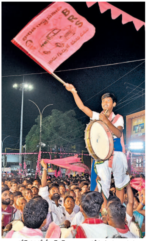
రోడ్ షోలో బీఆర్ఎస్ జెండా ఎగేస్తున్న కళాకారుడు

వరంగల్, ఏప్రిల్ 28 (నమస్తే తెలంగాణ ప్రతినీధి) : ఓరుగల్లు పోరు గల్లు అని, పోరాటాలకు నిలయమని బీఆర్ఎస్ అధినేత కేసీఆర్ అన్నారు. తెలంగాణ రాష్ట్ర సాధన ఉద్యమంలో వరంగల్ తనకు ఎంతో అనుబంధం ఉన్నదని చెప్పారు. 1969లో తెలంగాణ ఉద్యమ సమయంలో జయశంకర్ సారు ప్రత్యేక రాష్ట్ర పోరాటంలోకి వచ్చారని, మలిదశ పోరాటంలో ఆయన కల నెరవేరిందని పేర్కొన్నారు. సమైక్య రాష్ట్రంలో ఉమ్మడి వరంగల్ జిల్లా ప్రగతి పథంలో సాగిందని చెప్పారు. ఎస్సారే స్పీకి గతంలో నీళ్లు ఉండేవి కాదని, కాశేశ్వరం ప్రాజెక్టుతో ఉమ్మడి జిల్లాలో పంటలు పుష్కలంగా పంపాయని అన్నారు. కాశేశ్వరం కట్టిన తర్వాత పరకాల, భూపాలపల్లి, వర్ధన్నపేట, నర్సంపేట, మహబూబాబాద్, డోర్నకల్, పాలకుర్తి నియోజకవర్గాల్లో సాగునీరు అందిందని వివరించారు. బీఆర్ఎస్ ప్రభుత్వం వరంగల్ లో ఆకాశమంత ఎత్తులో సూపర్ స్పాటిల్ పోస్టును నిర్మించిందని అన్నారు. దేశంలోనే అతి పెద్ద టెక్నోజిల్ పార్కును పరకాల నియోజకవర్గంలో చల్లా ధర్మారెడ్డి ఆధ్వర్యంలో నిర్మించుకున్నామని చెప్పారు. ఉమ్మడి రాష్ట్రంలో ఒక్క