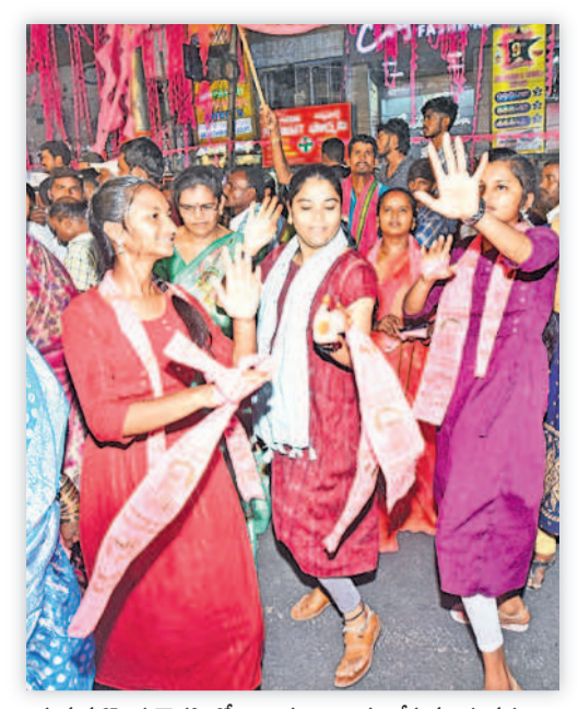
హనుమకొండ చౌరస్తాలో ఉత్సాహంగా స్టెప్పు లేస్తున్న యువతులు

5 | సోమవారం 29 ఏప్రిల్ 2024 | WARANGAL HANUMAKONDA