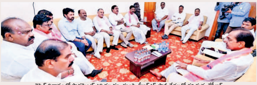
కెప్టెన్ నివాసంలో పార్లమెంట్ ఎన్నికల పూర్వంపై బీఆర్ఎస్ వాటి నేతలతో చర్చిస్తున్న కేసీఆర్