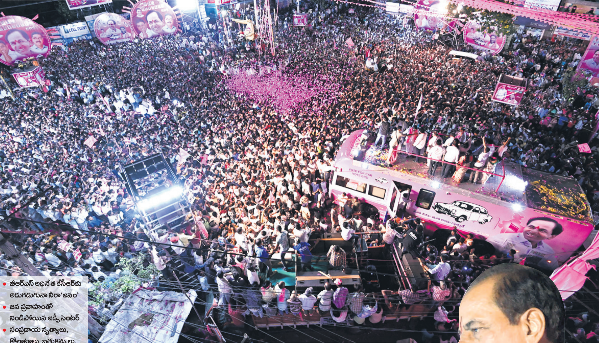
ఖమ్మం జడ్పీ సెంటర్లో రోడ్షాకు హాజరైన అశేష జనవాహినీని ఉద్దేశించి ప్రసంగిస్తున్న బీఆర్ఎస్ అధినేత కేసీఆర్