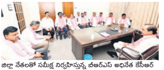
జిల్లా నేతలతో సమీక్ష నిర్వహిస్తున్న బీఆర్ఎస్ అధినేత కేసీఆర్

ఖమ్మం, ఏప్రిల్ 29 (సమస్త తెలంగాణ ప్రతినిధి): ఖమ్మం లోక్ సభ స్థానం నుంచి బీఆర్ఎస్ అభ్యర్థి నామా నాగేశ్వరరావు గెలుపు తథ్యం ముఖ్యమంత్రి కేసీఆర్ సర్వస్వం చేశారు. ఖమ్మం సోమవారం రాత్రి నిర్వహించిన బస్సు యాత్ర, రోడ్ షో అసెంబ్లీ జిల్లా నేతలతో సమీక్ష నిర్వహిస్తున్న బీఆర్ఎస్ అధినేత కేసీఆర్ తరం పార్టీ జిల్లా నేతలతో ఆయన సమీక్షా సమావేశం నిర్వహించారు. ఈ సందర్భంగా ఆయన మాట్లాడుతూ.. సర్వోచస్థి నామా నాగేశ్వరరావుకు అనుకూలంగా వస్తున్నాయని అన్నారు. మిగతా పార్టీ అభ్యర్థుల కంటే బీఆర్ఎస్ అభ్యర్థి నామా నాగేశ్వరరావు ముందంజలో ఉన్నట్లు చెప్పారు. పార్టీ నేతలు, కార్యకర్తలు మరింత కష్టపడి పని చేస్తే అత్యధిక మెజారిటీ తథ్యమని సర్వస్వం చేశారు. రాష్ట్రంలో కూడా బీఆర్ఎస్ సునామీ ఖాయమన్నారు. మొత్తం 12 సీట్లలో బీఆర్ఎస్ ఘన విజయం సాధిస్తుందని ధీమా వ్యక్తం చేశారు.