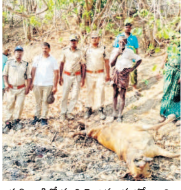
పులి దాడిలో మృతి చెందిన ఆవు కఠిబరారు పరిశీలించుతూ ఉన్న అధికారులు