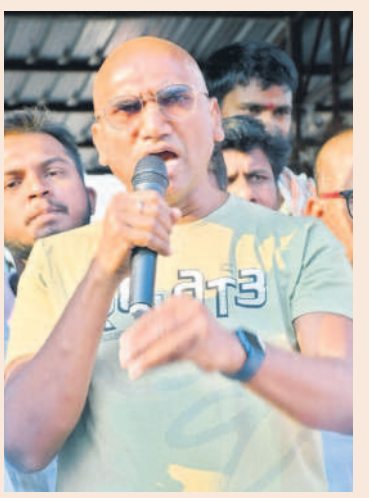
అని చూస్తున్నాడు. ఎవరు హామీలు చెప్పారో.. ఎవరు విఫలమయ్యారో ప్రజలు ఆలోచించుకోవాలి. అటు కేంద్రం, అటు రాష్ట్రం ప్రజలను ముంచడంలో ప్రావీణ్యాన్ని సంపాదించుకున్నాయి. నడిగట్ట బిళ్లెనైన నన్ను పార్లమెంట్ కు పంపిస్తే మీ సమస్యలు పరిష్కరిస్తాను.

కేసీఆర్ హయాంలోనే అన్ని వర్గాలకు అట్టి కేకారం దన్ను వివేకవాన్ ప్రజలు గుర్తుచేసుకోవాలి. గతంలో తాను గురుకులాలు ముఖ్యకార్యదర్శులుగా ఉన్నప్పుడు కేసీఆర్ సహకారంతో మహిళలకు పాఠశాలలు ఏర్పాటు చేశాం. విద్యార్థుల భవిష్యత్తును దృష్టిలో ఉంచుకొని కంప్యూటర్లను ఏర్పాటు చేసి విద్యను అందించిన ఘనత కేసీఆర్ కే దక్కుతుంది. రాష్ట్రం అన్ని రంగాల్లో అభివృద్ధి చెందడానికే పార్లమెంట్ లో బీఆర్ఎస్ ఎంపీలు ఉంటేనే సాధ్యమవుతుంది. హైదరాబాద్ కు ఎన్నో ఇటీ కంపెనీలను తీసుకొచ్చి ఉద్యోగ అవకాశాలు కల్పించిన ఘనత బీఆర్ఎస్ ప్రభుత్వానికే దక్కుతుంది. పరిశ్రమ నిజానికి, వంద రోజుల అబద్ధానికి ఇప్పుడు గుర్తున్న ఎన్నికల్లో బీఆర్ఎస్ అధినేత కేసీఆర్ వెళ్తున్న అంబుల బాది. రెవెన్యూ రికార్డులకు అనుగుణంగా లెక్కలు వేసి అధికారులకు ఎన్నో ఇటీ కంపెనీలను తీసుకొచ్చి ఉద్యోగ అవకాశాలు కల్పించిన ఘనత బీఆర్ఎస్ ప్రభుత్వానికే దక్కుతుంది. పరిశ్రమ నిజానికి, వంద రోజుల అబద్ధానికి ఇప్పుడు గుర్తున్న ఎన్నికల్లో బీఆర్ఎస్ అధినేత కేసీఆర్ వెళ్తున్న అంబుల బాది. రెవెన్యూ రికార్డులకు అనుగుణంగా లెక్కలు వేసి అధికారులకు ఎన్నో ఇటీ కంపెనీలను తీసుకొచ్చి ఉద్యోగ అవకాశాలు కల్పించిన ఘనత బీఆర్ఎస్ ప్రభుత్వానికే దక్కుతుంది.