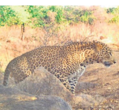
గంగాం ఫార్మర్స్ లో సీని తెమెరాకు చిక్కిన చిరుత

బీజేసీపల్లి, ఏప్రిల్ 29 : మండలంలోని గంగాం, అట్టపల్లి, మవ్వానూపల్లిని ఆసుకొని ఉన్న అడవిలో చిరుతలు సంపదాన్ని వేస్తున్నాయిని చిరుతల సంరక్షణ భయంకరంగా గుర్తుచేస్తున్నారు. దీంతో అటవీశాఖ అధికారులు ఇటీవల అడవిలో సీని తెమెరా లు అమర్చారు. కాగా గంగాం అటవీ ప్రాంతంలోని నేరే దువంపు సమీపంలో, సోలార్ అధికారికీ వద్ద నీటిని తాగుతూ మూడు చిరుతలు తెమెరాకు చిక్కారు. నీటి కుంటల వద్ద సాంబారులు అనే అడవి జంతువులు కూడా కనిపించాయి. అడవిలో చిరుతలు సంపదాన్ని వేస్తున్నాయని నిర్ధారణ కావడంతో ప్రజలు అందోళన చెందుతున్నారు. త్వరలోనే చిరుతలను పట్టుకుంటామని అటవీ శాఖ అధికారులు చెబుతున్నారు.