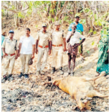
పులి దాడిలో మృతి చెందిన ఆవు కళ్ళబరాన్ని పరిశీలిస్తున్న ఫార్వెస్ట్ అధికారులు