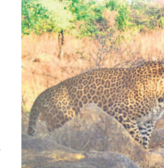
గంగాం ఫార్వెస్ట్ లో సీసీ కెమెరాకు చిక్కిన చిరుత

బిజినేపల్లి, ఏప్రిల్ 29 : మండలంలోని గంగాం, లట్టుపల్లి, మహాయిపల్లిని ఆనుకొని ఉన్న అడవిలో చిరుతలు సంపదీస్తున్నాయని చుట్టుపక్కల గ్రామాల ప్రజలు భయాందోళనకు గురవుతున్నారు. దీంతో అటవీశాఖ అధికారులు ఇటీవల అడవిలో సీసీ కెమెరా లు అమర్చారు. కాగా గంగాం అటవీ ప్రాంతంలోని నేరేడుపల్లి సమీపంలో, సోలార్ అధికారంలోకి వచ్చిన నేరేడుపల్లి మూడు చిరుతలు కెమెరాకు చిక్కాయి. నీటి కుంటల వద్ద సాంబారులు ఆనే అడవి జంతువులు కూడా కనిపించాయి. అడవిలో చిరుతలు సంపదీస్తున్నాయని నిర్ధారణ కావడంతో ప్రజలు ఆందోళన చెందుతున్నారు. త్వరలోనే చిరుతలను పట్టుకుంటామని అటవీశాఖ అధికారులు చెబుతున్నారు.