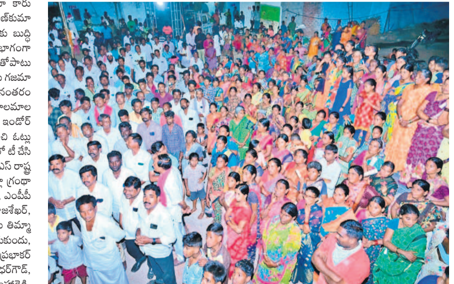
జోగుశాల గద్వాల జిల్లా మల్లకల్ మండల కేంద్రంలో జరిగిన ప్రచార కార్యక్రమానికి హాజరైన బీఆర్ఎస్ నాయకులు, కార్యకర్తలు, మహిళలు

టీసీలు, ఇంటియాజ్, కౌన్సిలర్లు, స్థానిక నాయకులు, కార్యకర్తలు పాల్గొన్నారు.