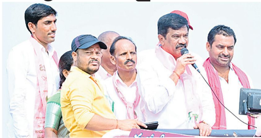
రోడ్ షోలో మాట్లాడుతున్న ప్రచారకర్త