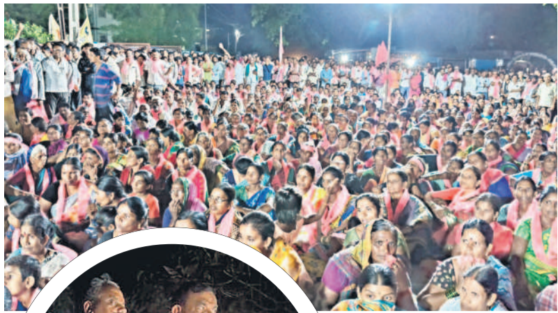
బిచ్చంపల్లిలో కార్యక్రమాలలో పాల్గొన్న జనం