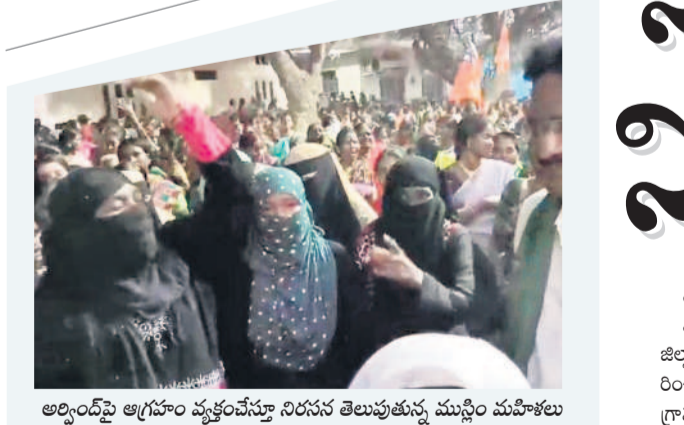
అల్పవయస్కులకు అందజేసిన నిరసన తెలుపుతున్న ముస్లిం మహిళలు