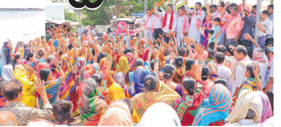
బషీరాబాద్ మండలంలోని మైలార గ్రామంలో మద్దతు తెలుపుతున్న మహిళలు