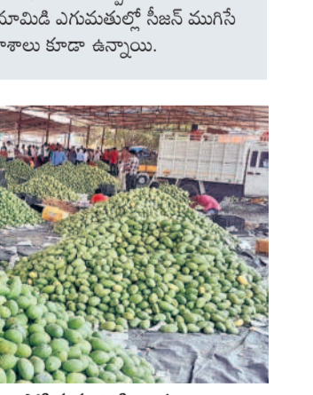
ఇతర రాష్ట్రాలకు ఎగుమతి చేసేందుకు మామిడి కొరత బుద్ధిలో నింపుతున్న వ్యాపారులు