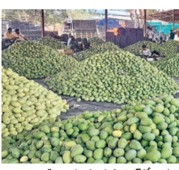
బాట సింగారం పండ్ల మార్కెట్ లో రానున్నా పోసిన మామిడి కొరత

రైతులకు గిట్టుబాటు ధర.. బాట సింగారం పండ్ల మార్కెట్ లో మామిడికి ఆశించిన స్థాయిలో గిట్టుబాటు ధర వస్తున్నట్లు రైతులు తెలిపారు. ఒక టన్ను మామిడి కొరత అకు రూ.25 వేల నుంచి రూ.85 వేల వరకు ధరలు పలుకుతున్నాయి. నాణ్యమైన పండ్లకు గిట్టుబాటు ధరలు వస్తుండటంతో రైతులు సంతోషిస్తున్నారు. మామిడి సీజన్ ముగిసే వరకు రైతులకు నాణ్యమైన గిట్టుబాటు ధర అందేలా అధికారులు చర్యలు తీసుకుంటున్నారు. అలాగే, వ్యాపారులు కొనుగోలు చేసిన మామిడిని నిల్వ ఉంచుకోవటం కోసం కోట్ల స్టోర్ లో సౌకర్యాన్ని కూడా అధికారులు కల్పించారు. దీంతో బాట సింగారం పండ్ల మార్కెట్ లో మామిడి ఎగుమతుల్లో సీజన్ ముగిసే సరికి మంచి లాభాలు గడించే అవకాశాలు కూడా ఉన్నాయి.