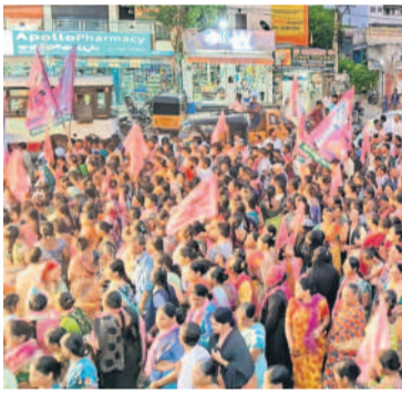
తుర్యయాంజాల్ రోడ్డు వాణి హాజరిన ప్రజాసభ