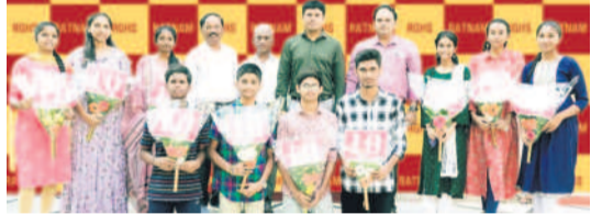
విద్యార్థులతో పాఠశాల కరస్పాండెంట్, ఉపాధ్యాయులు