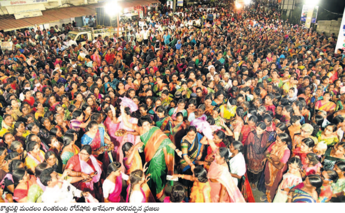
కొత్తపల్లి మండలం చింతకుంట రోడ్ షోకు అనేకంగా తరలివచ్చిన ప్రజలు