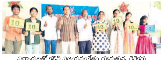
విద్యార్థులతో కలిసి విజయసంకేతం చూపుతున్న డైరెక్టర్