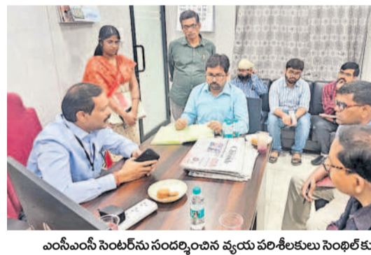
ఎంపీఎస్ సెలక్షన్ కమిటీ సందర్శించిన వ్యయ పరిశీలకులు సంబంధితులమార్

సిటీబ్యూరో: మే 1, (నమస్తే తెలంగాణ): పార్లమెంటు ఎన్నికలను పురస్కరించుకొని జిల్లా ఎన్నికల అధికారి కార్యాలయంలోని బీసీ పీఆర్ డి కార్యాలయంలో ఏర్పాటు చేసిన మీడియా సభ్యులతో ఆంధ్ర మాసపత్రిక కమిటీ (ఎంపీఎస్) సెలక్షన్ పై హైదరాబాద్ పార్లమెంటు నియోజకవర్గం ఎన్నికల వ్యయ పరిశీలకులు సెలక్షన్ కమిటీ బుద్ధవారం పరిశీలించారు. ఎంపీఎస్ ద్వారా చేపడుతున్న కార్యకలాపాలను అడ్డిగి తెలుసుకున్నారు. రికార్డులను క్షుణ్ణంగా తనిఖీ చేశారు. అడ్వర్టైజ్ మెంట్, చెల్లింపు వార్షిక గుర్తింపు, అభ్యర్థుల ఎన్నికల ప్రచారానికి సంబంధించి ఇప్పట్ను అనుమతులు, ఆయా రిజిస్ట్రేషన్ నిర్వహణ తీరు తెన్నులను పరిశీలించి.. సంవత్సర వ్యయం చేశారు. సామాజిక మాధ్యమాల్లో ఎన్నికల అంశాలకు సంబంధించి మరలించక దృష్టిని పట్టాలని ఎంపీఎస్ నోడల్ అధికారికి సంబంధించి సూచించారు. ఫేస్ బుక్, ట్విట్టర్, వాట్సాప్, ఇన్ స్టాగ్రామ్ తదితర సామాజిక మాధ్యమాల్లో పార్లమెంటు ఎన్నికల్లో ముడిపడిన అంశాలను నిత్యం నిశితంగా పరిశీలించాలని సూచించారు. బల్కే ఎంపీఎస్ లకు సంబంధించిన అభ్యర్థులు ఎంపీఎస్ నుంచి తప్పనిసరిగా అనుమతులు పొందాలన్నారు. మీడియా సభ్యులతో ఆంధ్ర మాసపత్రిక కమిటీ, ఎలక్షన్ విక్రయాలపై మాసపత్రిక కమిటీ, ఎంపీఎస్ నోడల్ అధికారులు సమన్వయంతో పనిచేయాలన్నారు.