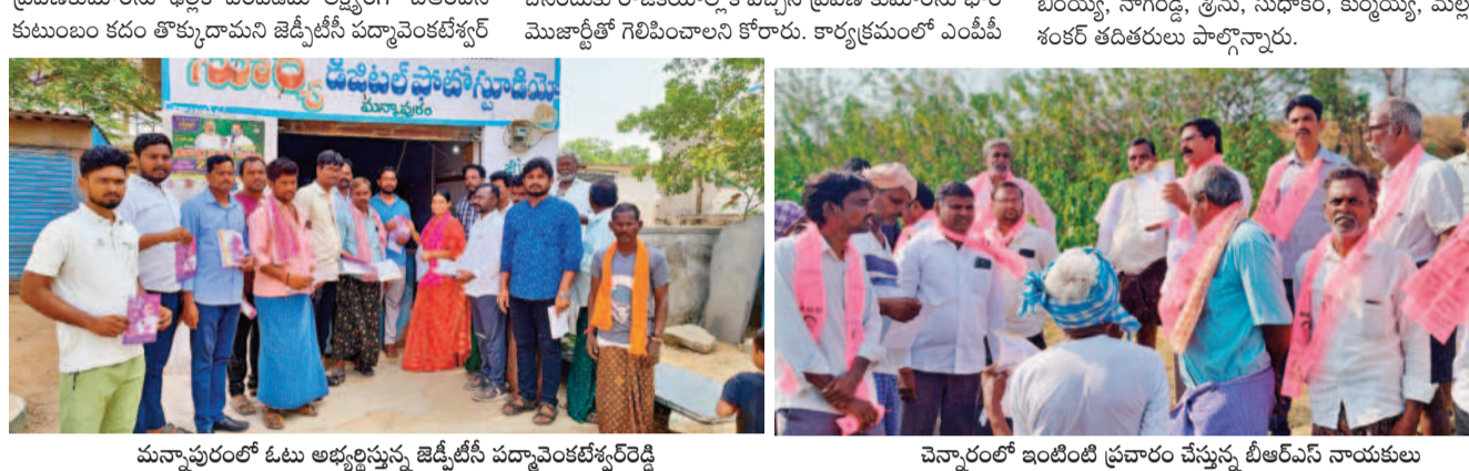
చెన్నారంలో ఇంటింటి ప్రచారం చేస్తున్న టీఆర్ఎస్ నాయకులు