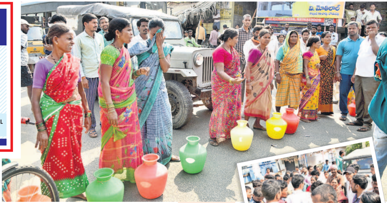
తాగునీటి కోసం రాస్పాన్ కో చేస్తున్న మహిళలు