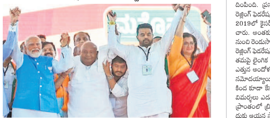
గత నెల 14న ఓ ఎన్నికల ప్రచార సభలో దేవెగడ, ప్రజ్వల్ తో ప్రధాని మోదీ