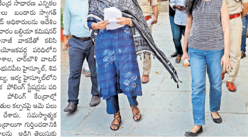
సమస్యాత్మక పోలింగ్ కేంద్రాలపై పరిశీలిస్తున్న ఎన్నికల పరిశీలకురాలు బండారు స్వాగత్ రక్షణ్ చంద్, కమిషనర్ అశ్వినీ తానాజ్ వాడే

వరంగల్, మే 8 : సమస్యాత్మక పోలింగ్ కేంద్రాలపై ప్రత్యేక దృష్టి సారించాలని కేంద్ర నాదారణ ఎన్నికల పరిశీలకురాలు బండారు స్వాగత్ రక్షణ్ చంద్ అధికారులను ఆదేశించారు. శుక్రవారం బల్లియా కమిషనర్ అశ్వినీ తానాజ్ వాడేతో కలిసి తూర్పు నియోజకవర్గ పరిధిలోని సీపీఎం కళాశాల, వారిపోలి వాలర్ ట్యాంక్, శంభునపేట హైస్కూల్, శివ నగర్, కౌటల్, అల్లం హైస్కూల్ లోని సమస్యాత్మక పోలింగ్ స్టేషన్లను పరిశీలించారు. పోలింగ్ కేంద్రాల్లో హాతిక వసతుల కల్పనపై ఆమె పలు సూచనలు చేశారు. సమస్యాత్మక పోలింగ్ కేంద్రాలూ గుర్తించడానికి గల కారణాలను అడిగి తెలుసుకున్నారు. ఈ కేంద్రాల పరిధిలోని పోలింగ్ కేసుల వివరాలపై ఆరా తీశారు. ఎలక్షన్ లో అధికారులు సమస్యలను గుర్తించాలని, ఎలాంటి అవాంఛనీయ ఘటనలు జరుగుతూ పోలింగ్ శాఖ సేవలు వినియోగించుకోవాలని ఆదేశించారు. కేంద్రాల వద్ద తాగునీటితో పాటు ఓటర్లను ప్యాకెట్లను అందుబాటులో ఉంచాలన్నారు. కార్యక్రమంలో ఏసీపీ నందరాం నాయక్, తహసీల్దార్ ఇక్బాల్, నాగేశ్వరరావు, జువలతిరెడ్డి, అరవింద్ కార్ నాగ్ పాల్గొన్నారు.