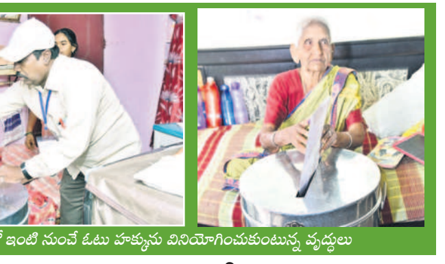
జిల్లా కేంద్రంలో ఇంటి నుంచే ఓటు హక్కును వినియోగించుకుంటున్న వ్యక్తులు