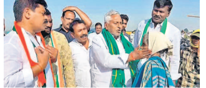
మహిళా కూలీ చెంప చెళ్లమనిషిస్తున్న కాంగ్రెస్ అభ్యర్థి, ఎమ్మెల్యే డి జీవన్ రెడ్డి