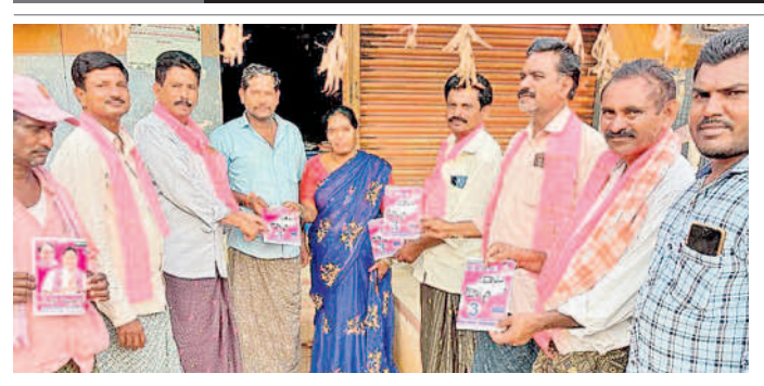
తోడేళ్లగూడెంలో ప్రచారం చేస్తున్న బీఆర్ఎస్ నాయకులు