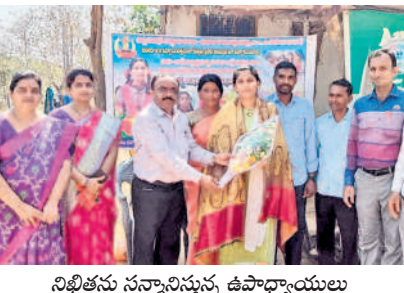
నిఖితను సన్మానిస్తున్న ఉపాధ్యాయులు