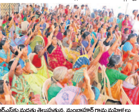
బీఆర్ఎస్ కు మద్దతు తెలుపుతున్న మంజూపూర్ గ్రామ మహిళలు