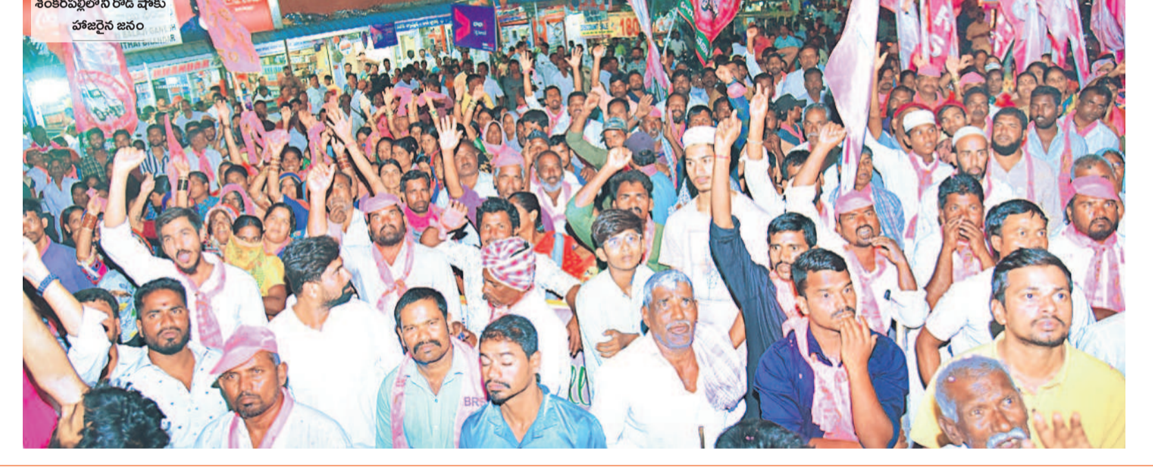
శంకర్ వల్లి రోడ్ షోకు హాజరైన జనం