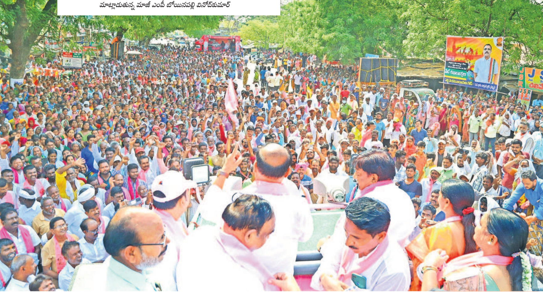
ముల్కనూరులో బీఆర్ఎస్ రోడ్ షోకు భారీగా తరలివచ్చిన ప్రజలు