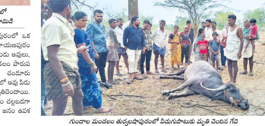
గుండా మండలం తుర్కపల్లిలో పిడుగుపాటుకు మృతి చెందిన గేదె