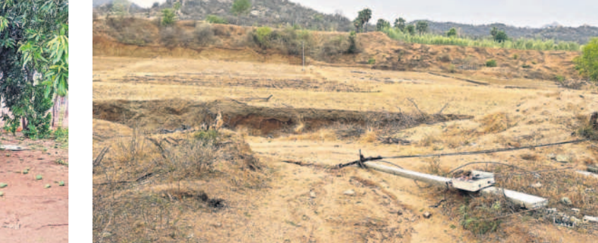
సంస్థాన్ నారాయణపురం : వెంకటాపి తండాలో నేలకూలిన స్తంభం