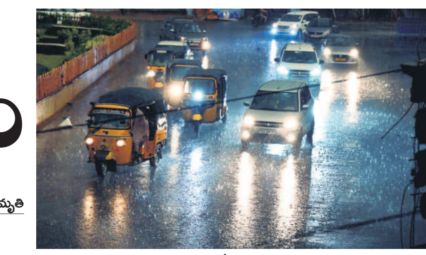
నల్లగొండలో కురుస్తున్న వర్షం