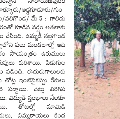
మోతూరులో నేలరాలిన మామిడి

సంస్థాన్ నారాయణపురం /మోతూరు/అడ్లగూడూరు/గుండా/పల్లిగొండ/ మే 5 : గాలిదుమారంతో కూడిన వర్షం అతలాకుతలం చేసింది. ఉమ్మడి నల్లగొండ జిల్లాలోని పలు మండలాల్లో ఆదివారం సాయంత్రం ఉరుములు మెరుపులు కురిశాయి. పిడుగుల వర్షం పడింది. ఈ దురుగాలులకు పలు చోట్ల ఇంటిపైకప్పు రేకులు ఎగిరి పడ్డాయి. చెట్లు విరిగిపడ్డాయి. విద్యుత్ స్తంభాలు నేలకొరిగాయి. తోటల్లో మామిడి కాయలు, నిమ్మకాయలు కింద కాలాయి. పిడుగుపాటుకు ఒక వ్యక్తి చనిపోయాడు. ఎనిమిది చతువులు మృత్యువాత పడ్డాయి. తాటి, కొబ్బరి చెట్లపై పిడుగులు పడి మంటలు చెలరేగాయి. కొనుగోలు కేంద్రాల్లో ధాన్యం తడిసింది. ఈ వర్షం ప్రజలతోపాటు రైతులను తీవ్ర ఇబ్బందులకు గురిచేసింది. అడ్లగూడూరు మండలం కోటమర్రిలో పిడుగుపాటు వ్యక్తి చనిపోయాడు. ఒక బల్లె మృతి చెందింది. గుండాలు మండలం తుర్కపల్లి పురం ఒక బల్లె, పల్లిగొండ మండలం వెంకటాపురంలో ఒక అవు, సంస్థాన్ నారాయణపురం మండలం గుణ్ణంలో రెండు అవులు, అత్తుకూర్, ఎం మండలం చందూరు తీవ్ర ఇబ్బందులకు గురిచేసింది. తిల్లిలో ఒక ఎద్దు, చందూరు మండలం ఉడుతపల్లిలో అవు పిడుగుపాటుకు మృతిచెందాయి. వర్షంతో వాతావరణం చల్లబడగా ఎండ వేడిమి నుంచి జనం ఉపశమనం పొందారు.