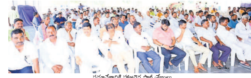
సమావేశానికి హాజరైన పార్టీ శ్రేణులు