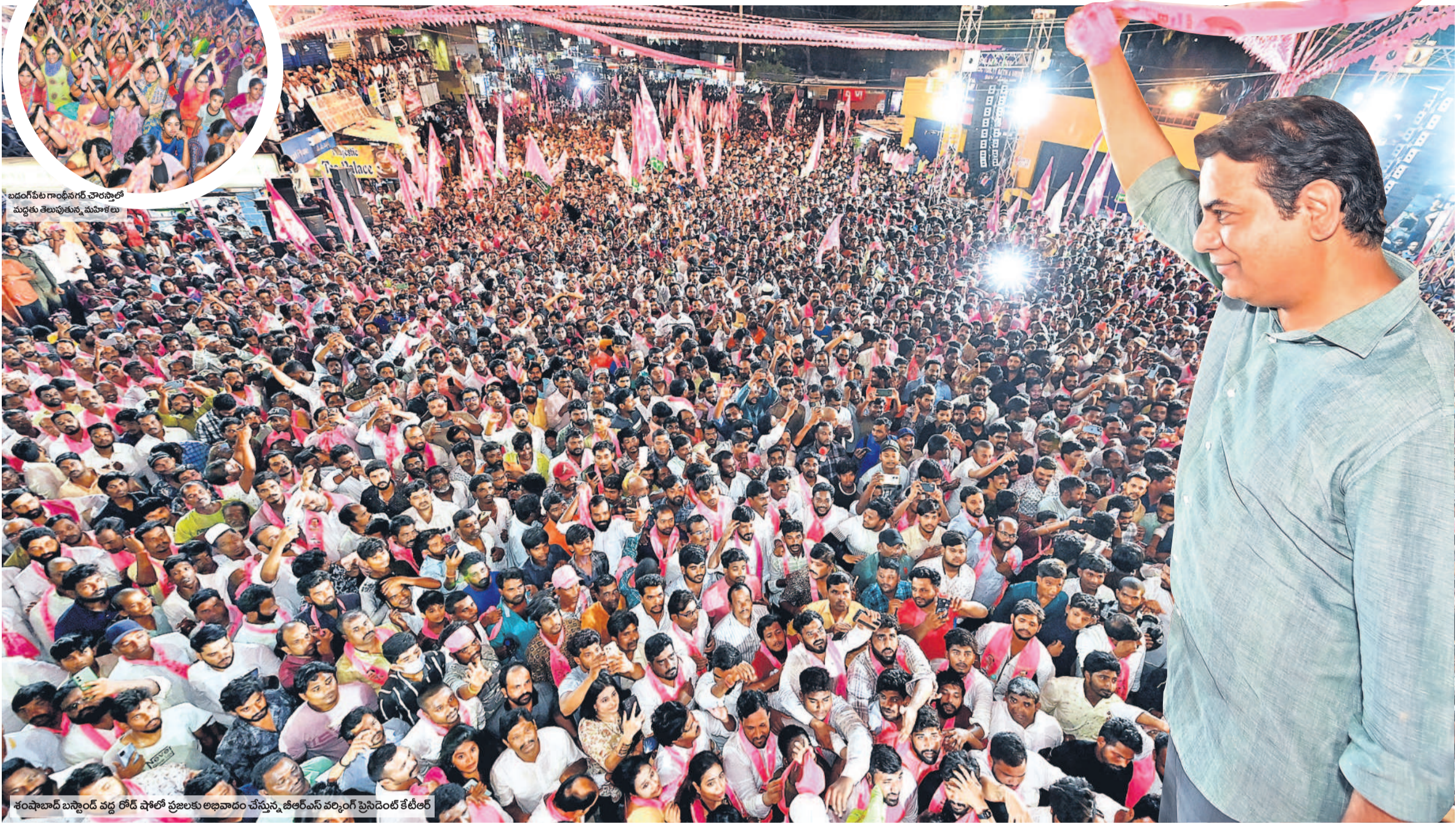
బందగోపాల్ గాంధీనగర్ చౌరస్తాలో మధ్యకు తిలుపుతున్న మహిళలు