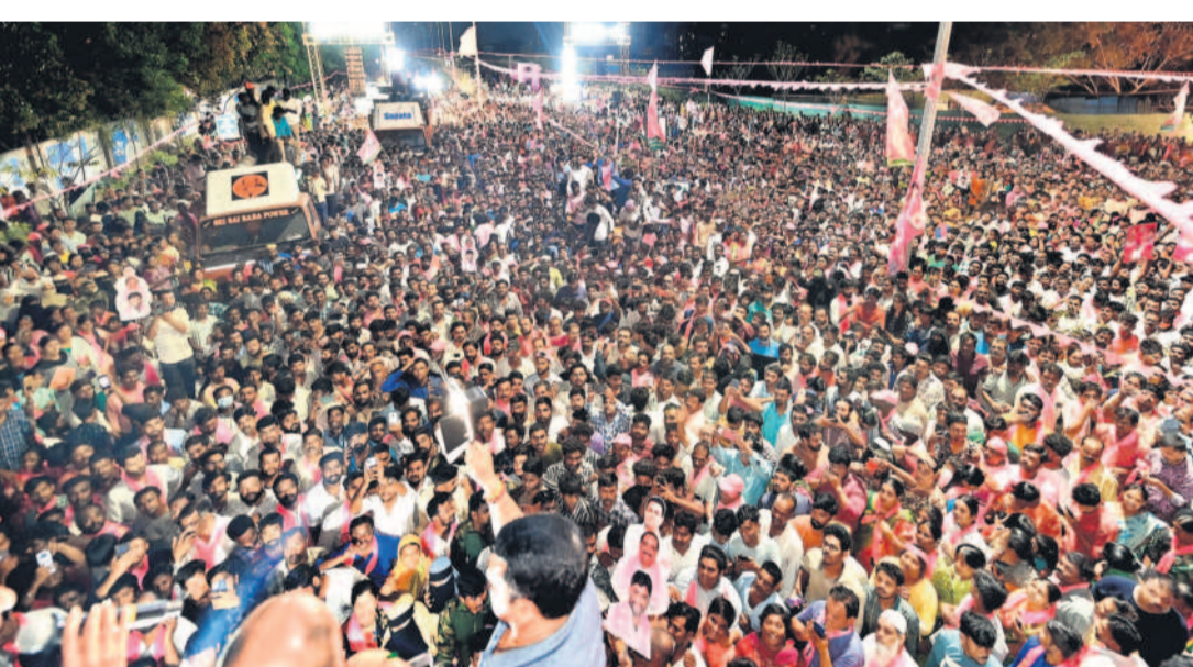
కొండాపూర్ అర్బన్ అఫీసు వద్ద కేటీఆర్ రోడ్ షోకు భారీగా హాజరైన జనం