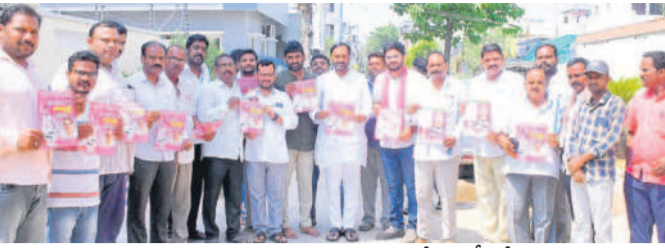
ప్రచార కార్యక్రమాలను అభివృద్ధి చేస్తున్న ఎమ్మెల్యే ఎంపీ కోటిరెడ్డి