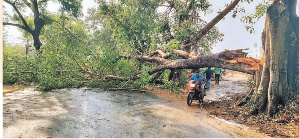
జనగామ మండలం కామిరేపేటలో జాతీయ రహదారిపై కూలిన భారీ వృక్షం