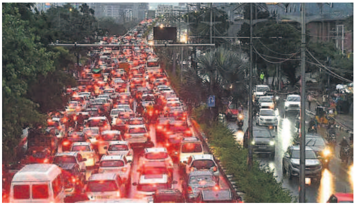
హైదరాబాద్ లో కులిసిన వర్షానికి భారీగా ట్రాఫిక్ జామ

కరీంనగర్ జిల్లాలో ముఖ్యమంత్రి రేవంత్ రెడ్డి పర్యటనకు భారీ వర్షం అంతరాయం కలిగింది. కరీంనగర్ జిల్లాలో కార్లలోని బ్యాటరీలు అంతరాయం కలిగింది. విద్యుత్తు చెట్ల కింద ఉండటం, ములుగు జిల్లా కన్నామరాగడం, ఏలూరు నాగారం, తాడూరు మండలం వల్ల విద్యుత్తు సరఫరా కోరారు. శిథిలావస్థలో ఉన్న భవనాలకు దూరంగా ఉండాలని, ఆసిఫాబాద్ జిల్లా వాంకిడి, చింతలపనపల్లి, పెనిచిక్క పేట, కాగజినగర్, కౌటాల, సిద్దాపర్