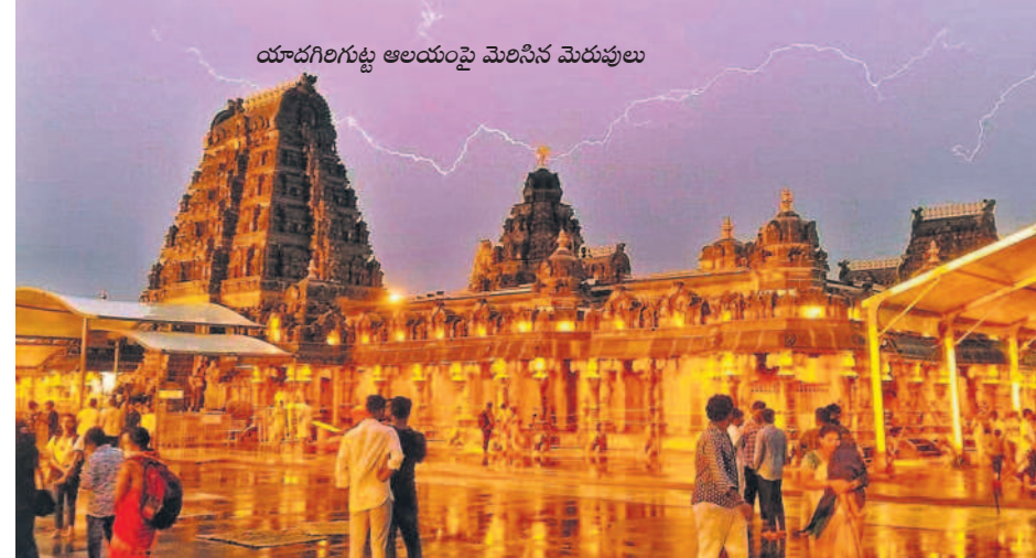
యాదగిరిగుట్ట అలయంపై మెరిసిన మెరుపులు