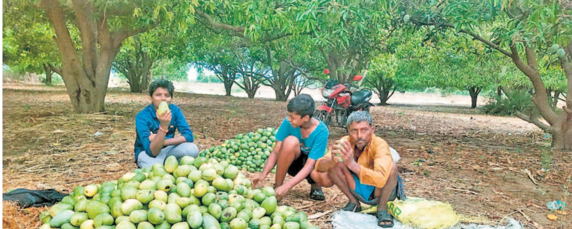
మంచిర్యాల జిల్లా వేమనపల్లి మండలంలోని నీలవాయల నేలరాల్లిన మామిడికాయలు

● ఇసుక డోనుతో.. ● కాంగ్రెస్ కు ఓపీ సుఖి ● ఇసుక కంట్రాక్టర్ల యజమానులకు పలకూరి జారీ ● లేవనవచ్చిన రూ. వెయ్యి వసూలు? మూసాపేట, మే 7 : మహబూబ్ నగర్ జిల్లా దేవరకర్ణ నియోజకవర్గంలోని ఓ.ఎస్.ఎస్. కౌన్సిల్ కార్యక్రమం ఇసుక కంట్రాక్టర్ల యజమానులకు పలకూరి జారీ చేసినట్లు సమాచారం. ప్రాజెక్ట్ యజమానులతో మాట్లాడుతూ.. 'మీ గ్రామ వాగు నుంచి ఎప్పుడైనా.. ఎక్కడెక్కడా ఇసుక కొట్టకండి.. కాంగ్రెస్ పార్టీకి ఓటు వేయండి.. పలువురితో వెయ్యి చాంది.. లేదంటే మీపై కేసులు నమోదు చేసి తాళి తీస్తా'ని భయపెడు తున్నట్లు తెలిసింది. ఎన్నికల సమయంలో అధికారులు పార్టీ కార్యకర్తలకు ప్రజల పక్షాన ఉంటారు.. ఎలాంటి ప్రలోభాలు జరగకుండా చూడాలి. కానీ ఓ పోలీసు ఇలా చెప్పడమేంటో ప్రజలు చెప్పలు కొరుక్కుంటున్నారు. ఆయన అధికార పార్టీకి మేలు చేస్తున్నట్లు నటిస్తూనే మరో వైపు ఇసుక కంట్రాక్టర్లకు రూ. వెయ్యి చొప్పున వసూలు చేస్తూ చేతివాటాన్ని ప్రదర్శిస్తున్నట్లు ఆరోపణలు ఉన్నాయి. ముఖ్యమంత్రి రేవంత్ రెడ్డి ఈ జిల్లా, పార్లమెంట్ ఎన్నికల కారణం కావాలని వెన్నోటాని గెలవాలని అధికార పార్టీ లక్ష్యంగా పెట్టు కున్నట్లు స్పష్టం చేశారు.