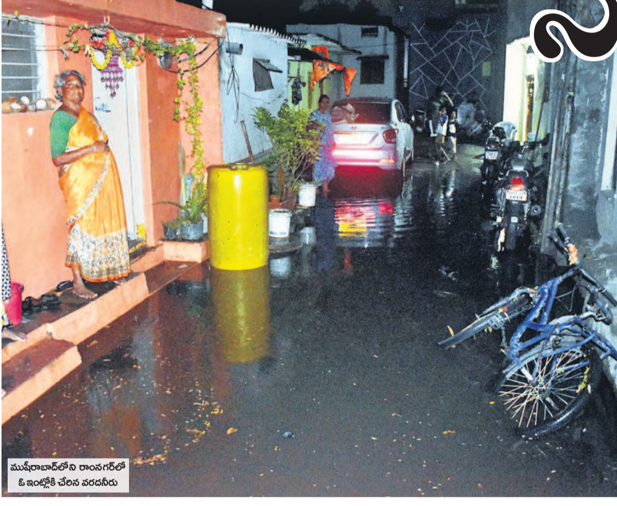
ముఖ్యరాజాద్‌లోని రాంనగర్‌లో ఓ ఇంట్లోకి చేరిన వరదనీరు