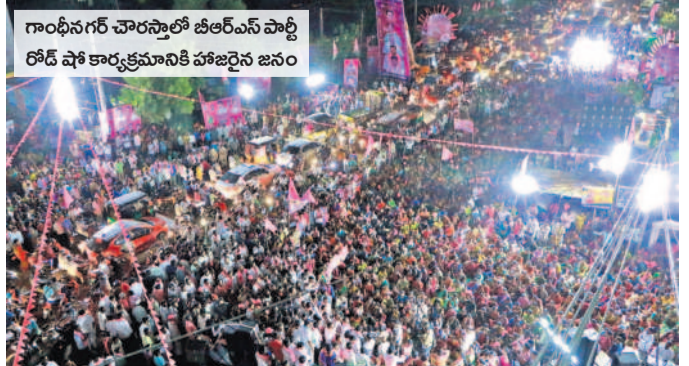
గాంధీనగర్ చార్లెస్టాన్ బీఆర్‌ఎస్ పార్టీ రోడ్ షో కార్యక్రమానికి హాజరైన జనం