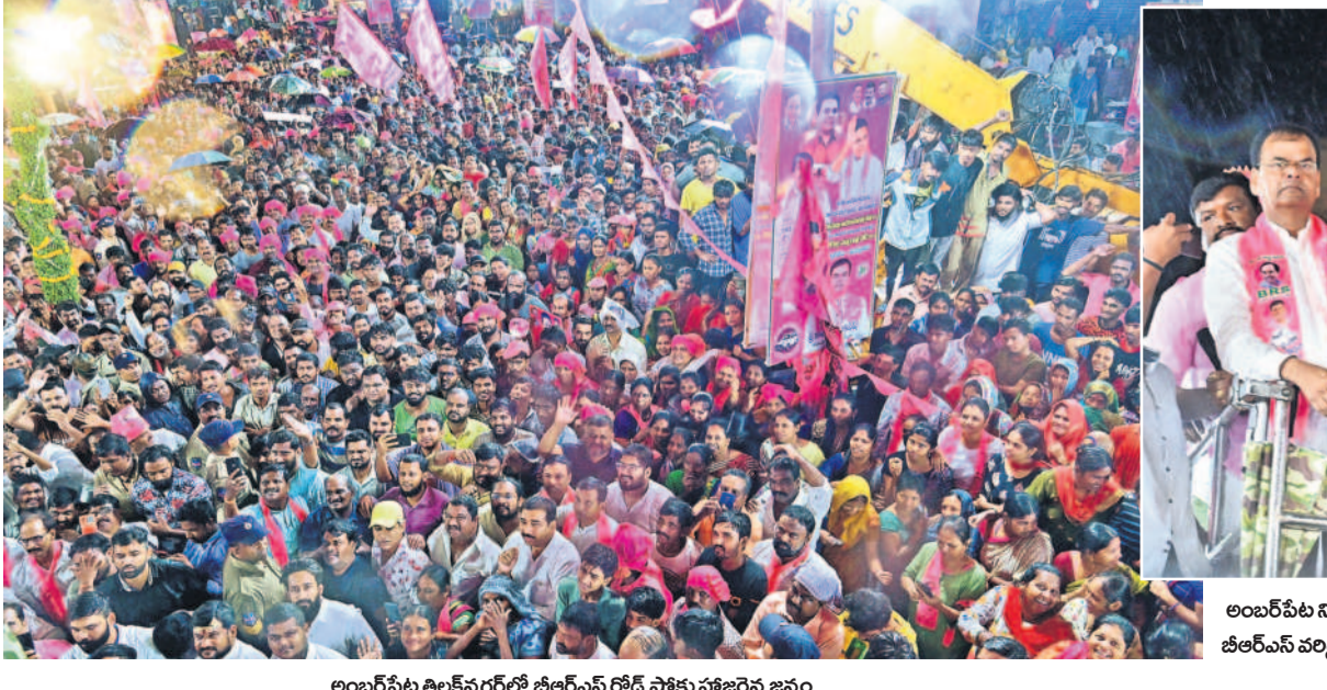
అంబర్‌పేట తిలక్‌నగర్‌లో బీఆర్‌ఎస్ రోడ్ షోకు హాజరైన జనం