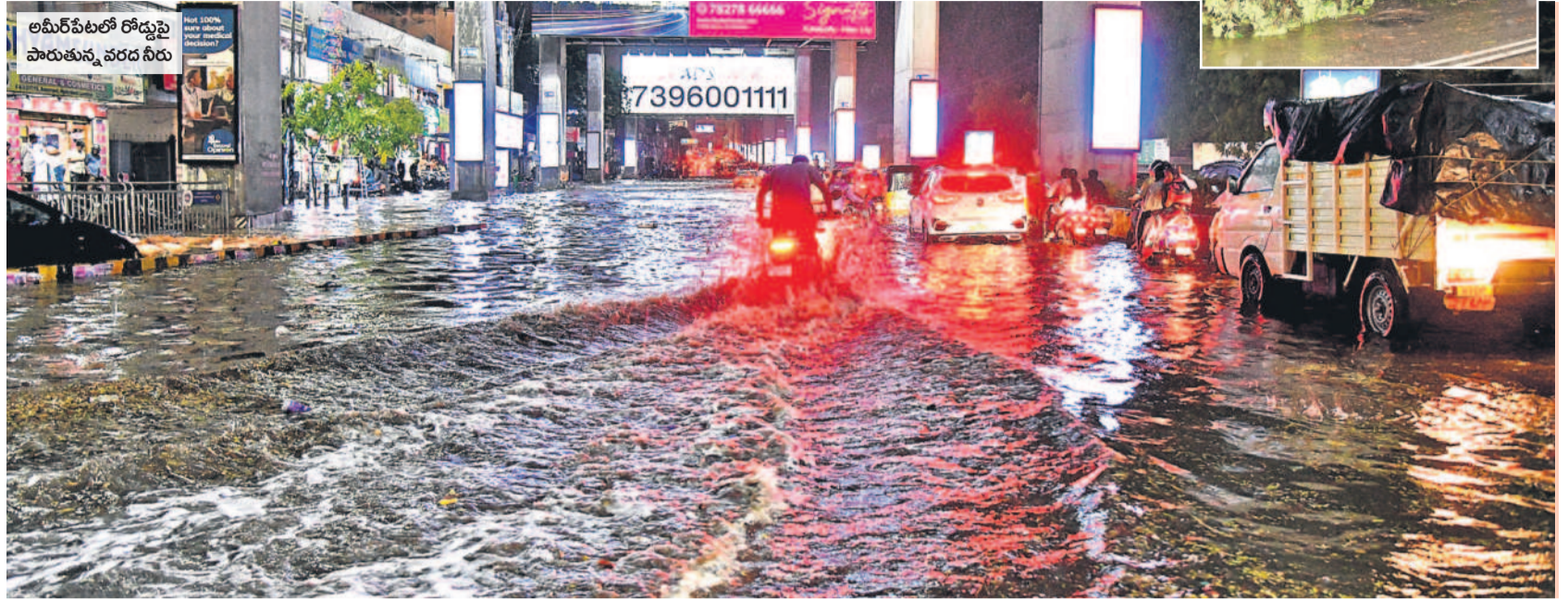
అమీర్‌పేటలో రోడ్డుపై పారుతున్న వరద నీరు