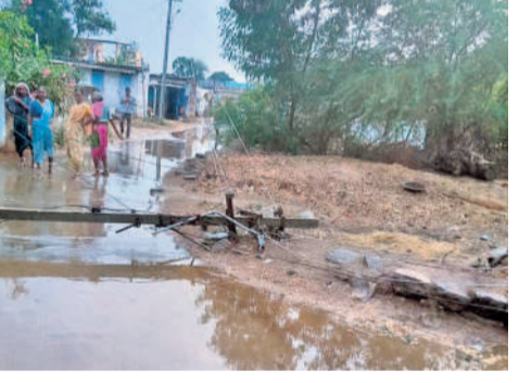
విన్నపెండ్యాలలో కూలిన కరెంటు స్తంభం