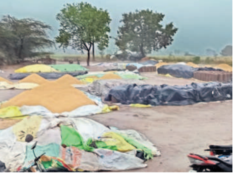
బసవోలు: కొండపల్లి కొనుగోలు కేంద్రంలో తడిసిన పరిధాన్యం