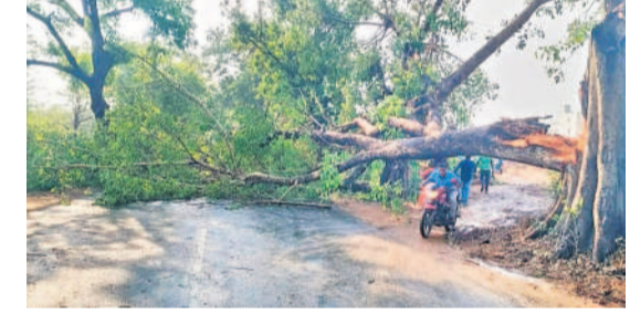
జనగామ: శామీరపేటలో జాతీయ రహదారిపై కూలిన భారీ వృక్షం

నీసునపూర్, చిల్కూరు మండలాల్లో వడగండ్ర వాన కురిసింది. మామిడి చెట్లకు కాలులు రాబోయాయి. కూరగాయలు, పండ్ల తోటలకు స్వల్పంగా నష్టం వాటిల్లింది. పలు ప్రాంతాల్లో విద్యుత్ సరఫరాలకు అంతరాయం ఏర్పడింది. తొర్రూరులో మోస్తరు వర్షం కురిసింది.