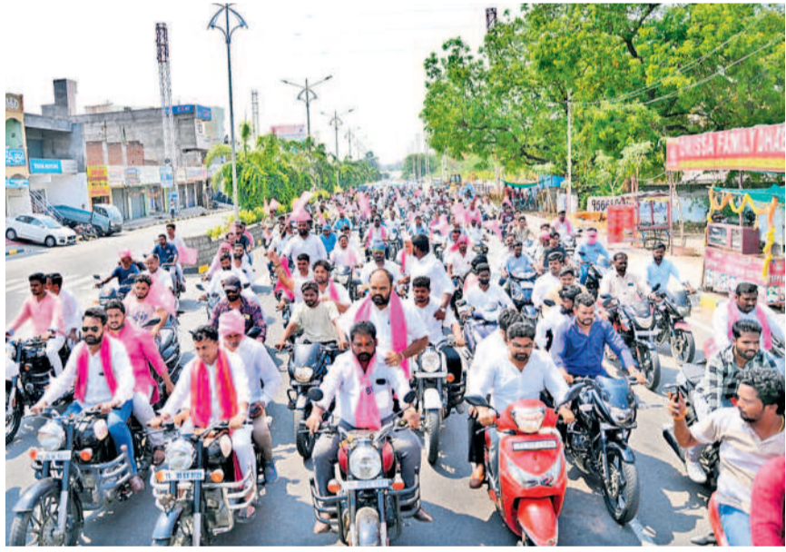
నల్లగొండలో బైక్ ర్యాలీ నిర్వహిస్తున్న బీఆర్ఎస్ నాయకులు, కార్యకర్తలు

వేసిన నోటిఫికేషన్ ఇచ్చి ఉద్యోగాలు ఇచ్చామనడం సిగ్గు చేటు. బీఆర్ఎస్ ఉద్యోగులకు మంచి పీఆర్ఎస్ ఇచ్చింది. కాంగ్రెస్ ఇచ్చిన హామీలు ఎందుకు అవ్వలేదు చేయడం లేదు.