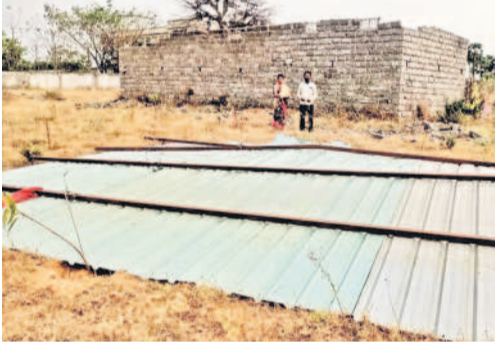
బుధరావుపేటలో గాలి దుమారానికి తేలిపడిన ఇంటి రేకులు