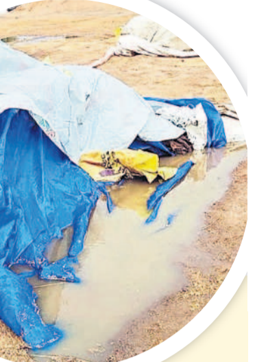
వెంకటాపూర్ (నూగూరు)లో తడిసిన ధాన్యం