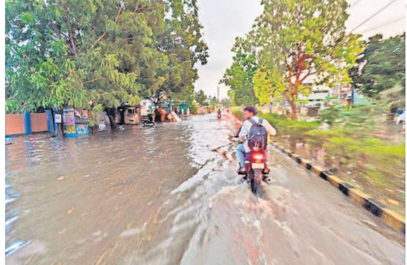
మడికొండలో జలమయమైన ప్రధాన రహదారి

నమస్తే నెట్ వర్క్, మే 7: ఉమ్మడి వరంగల్ జిల్లాను మంగళవారం ఈడురుగాలులు ఆగమానం చేశాయి. ఉరుములు, మెరుపులతో వర్షం కురిసింది. జయశంకర్ భూపాలపల్లి, ములుగు, హనుమకొండ, వరంగల్, జనగామ జిల్లాల్లో గాలిదుమారం బీభత్సం సృష్టించింది. పలుచోట్ల చెట్లు కూలి, విద్యుత్ స్తంభాలు విరిగిపడ్డాయి. గజపూరి, మహదేవపూరి, పలిమెల మండలాల్లోని కొనుగోలు కేంద్రాల్లో ధాన్యం తడిసి ముద్దయింది. ములుగు, ఏలూరునగరం, మంగలపేట, గోవిందరావుపేట, వెంకటాపూర్, వెంకటాపూర్ మండలాల్లో ధాన్యం రాపిడు తడిసి రైతులు ఇబ్బందులు పడ్డారు. బార్నాలిన్ షేడ్ల కిమ్మి కాపాడుకునే ప్రయత్నం చేశారు. కమలాపూర్, బసవోలు, శానువేపేట, ధర్మసాగర్, దామెర, కాజీపేట మండలాల్లో చెట్లు విరిగాయి. బానూరు, అత్తకూరు, వెన్నారాపుపేట, వర్షస్థపేట మండలాల్లో బలమైన ఈడురుగాలులు పలువురి ఇంటిపై కప్పలు ఎగిరిపడ్డాయి. గ్రోటర్ వరంగల్ లో సుమారు రెండు గంటల పాటు గాలి దుమారం బీభత్సం సృష్టించింది. దీంతో వాహనదారులు, బాటసారులు ఇబ్బందులు పడ్డారు. వర్షంతో హనుమకొండ బస్ స్టేషన్ జలమయం కాగా, పలు కాలనీల్లో వరద నీరు వచ్చి చేరింది. ఎన్నికల సేవద్దంలో ఏర్పాటు చేసిన ఫ్లెక్సీలు విరిగిపోగా, చెట్ల కొమ్మలు విరిగి పడ్డాయి. జనగామ, బచ్చన్నపేట, నర్సపేట, తరిగిపూల, రఘునాథపల్లి, స్థిప