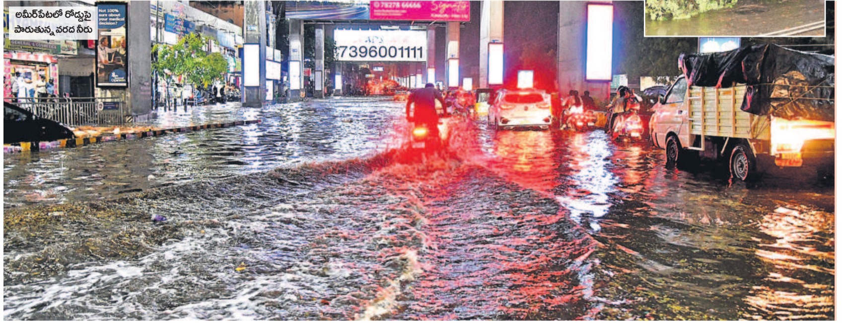
అమీర్ పేటలో రోడ్డుపై పారుతున్న వరద నీరు