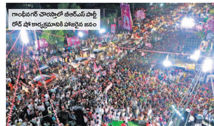
గాంధీ నగర్ చౌరస్తాలో బీఆర్ఎస్ పార్టీ రోడ్ షో కార్యక్రమానికి హాజరైన జనం