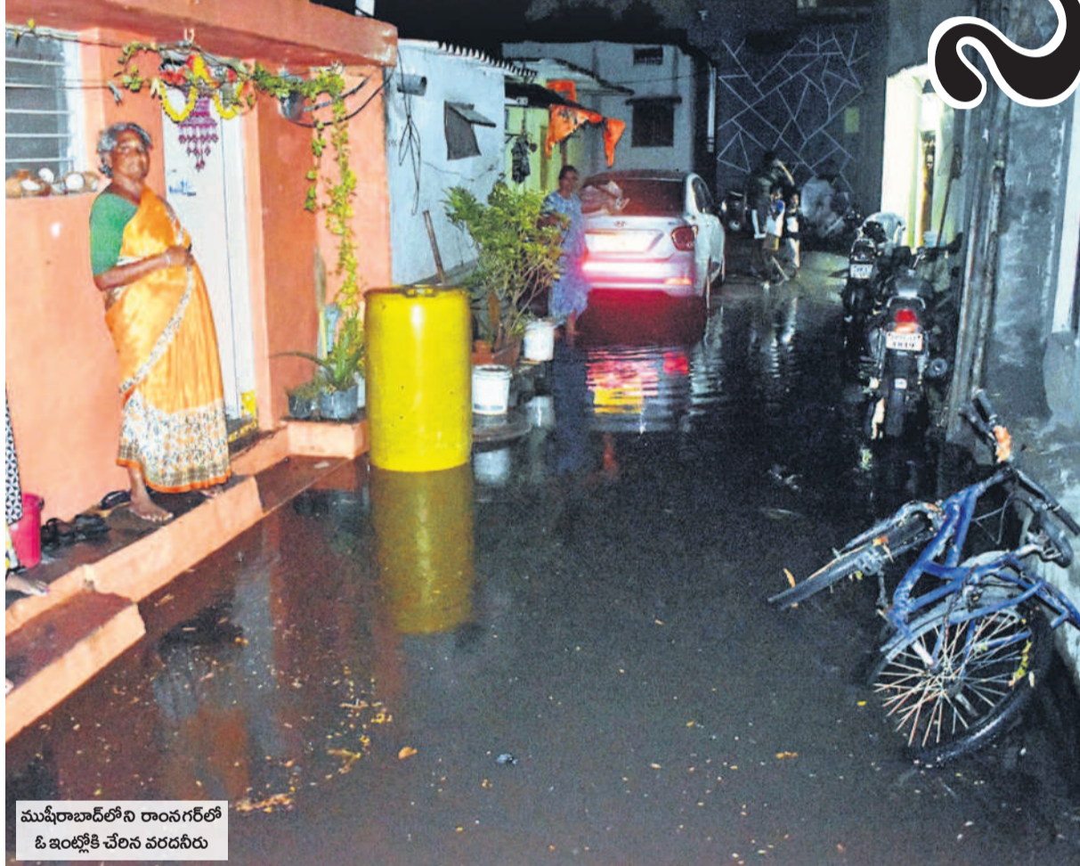
ముఖ్యరాబాద్ లోని రాంసగర్ లో ఓ ఇంట్లోకి చేరిన వరదనీరు

సాయంత్రం దంచికొట్టిన వాన.. రహదారులన్నీ జలమయం.. గంటల కొద్దీ నిలిచిపోయిన ట్రాఫిక్.. చెట్లు తెగిపడినా.. ఇళ్లలోకి నీళ్లు చేరినా సహాయ చర్యల వైపు కన్నెత్తి చూడని జీహెచ్ఎస్సీ.. ట్రాఫిక్ రద్దీని పట్టించుకోని పోలీసులు