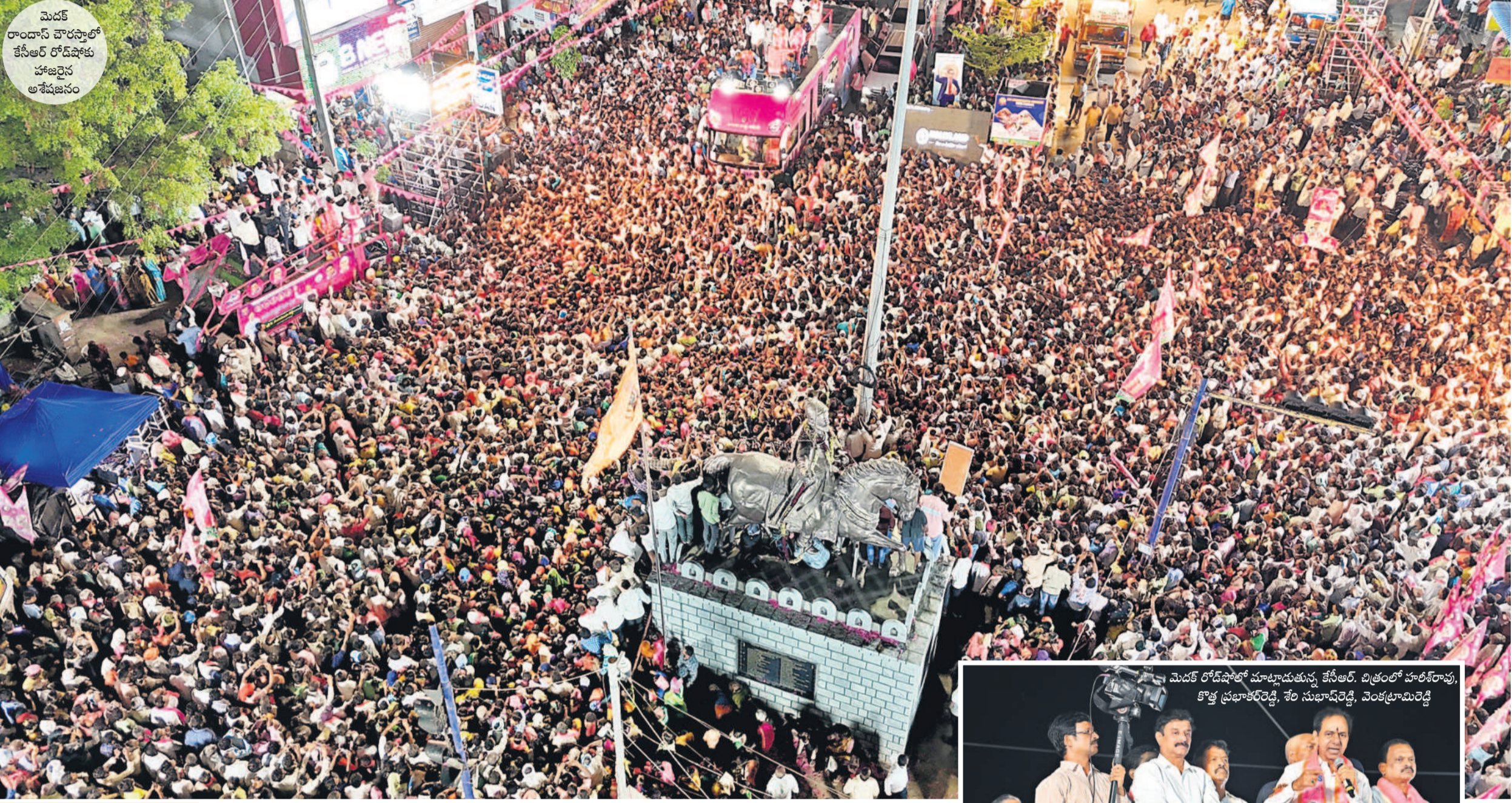
మెదక్ రాంధాస్ చౌరస్తాలో కేసీఆర్ రోడ్ షోలో హాజరైన అశేషజనం