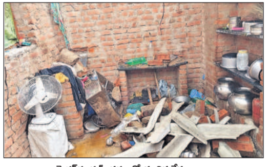
మెడక్ రూరల్ : వర్షంతో కూలిన రేకుల ఇల్లు