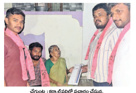
చేగుంట : కర్ణాటకలో ప్రచారం చేస్తున్న యూజీ సభ్యులు