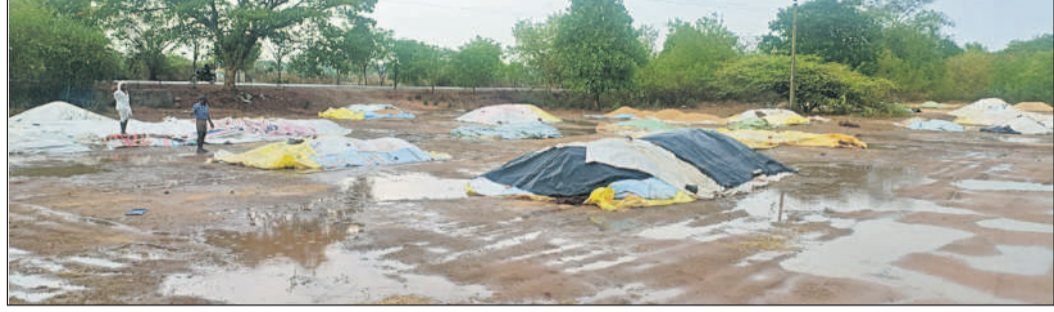
చిలిపిచెడ : చందూర్ వర్యానికి తడిసిన ధాన్యం