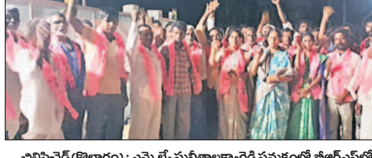
చిలిపిచెడ (కొల్లూరం) : ఎమ్మెల్యే సుమక్కంలో బీఆర్ఎస్ లో చేరుతున్న నేతలు

చిలిపిచెడ (కొల్లూరం), మే 7 : మండల కేంద్రమైన కొల్లూరం గ్రామానికి చెందిన