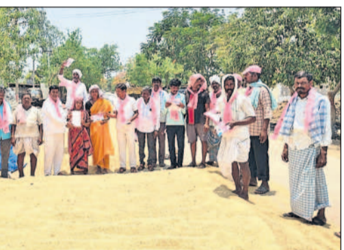
అల్లూరు: కామలంపల్లిలో ప్రచారం చేస్తున్న బీఆర్ఎస్ శ్రేణులు