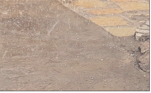
మెడక్ లో కురిసిన వడగండ