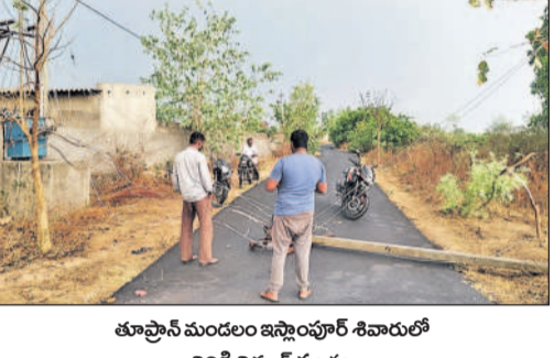
తూప్రాన్ మండలం ఇన్స్టాంపుర్ శివారులో విరిగి విడుదలై స్తంభం

మెడక్ మున్సిపాలిటీ/చిలిపిచెడ(కొల్లూరం)/మెడక్ రూరల్, మే 7 : ఈదురు గాలులు, వడగండతో మంగళవారం సాయంత్రం కురిసిన అకాల వర్షం జిల్లాలోని అన్నదాతలను కష్టాల్లోకి నెట్టింది. కొనుగోలు కేంద్రాల్లో సకాలంలో కొనుగోలు చేయకపోవడంతో ధాన్యం తడిసి ముద్దయింది. జిల్లాలోని ఆయా కొనుగోలు కేంద్రాల్లో సరైన వసతులు అధికారులు కల్పించక పోవడంతో రైతులకు నష్టం వాటిల్లింది. తడిసిన ధాన్యాన్ని ఎలాంటి తరుగు విధించకుండా ప్రభుత్వం కొనుగోలు చేయాలని రైతులు డిమాండ్ చేస్తున్నారు. మెడక్ మండల పరిధిలోని మర్నాపూర్ తండాలో వడగండ వర్షం, గాలి దుమారంతో రెండు ఇండ్లు కూలిపోయాయి.