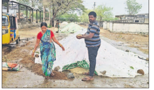
మెడక్ మున్సిపాలిటీ : తడిసిన ధాన్యాన్ని చూపిస్తున్న రైతులు