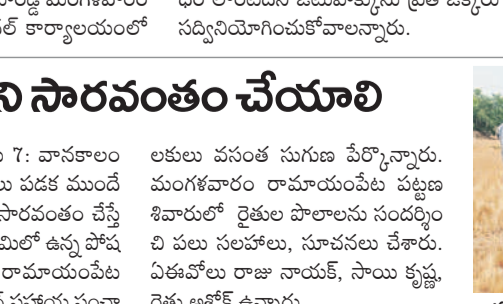
భూమిని సారవంతం చేయాలి వ్యవసాయ శాఖ అధికారులు