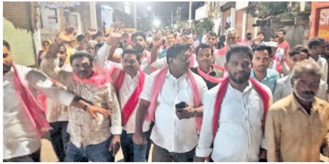
జోష్ నింపిన రోడ్ పేజీ.. ఎన్నికల ప్రచారంలో భాగంగా మంగళవారం మెడక్ కు విచ్చేసిన బీఆర్ఎస్ అభినేత కేసీఆర్ కు నాయకులు, కార్యకర్తలు, మహిళలు ఘన స్వాగతం పలికారు. మెడక్లోని ప్రధాన కూడలిని రాంధాన చౌరస్తాలో నిర్వహించిన రోడ్ పేజీ జనసంద్రంగా మారింది. -మెడక్ మున్సిపాలిటీ, మే 7