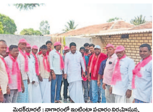
మెడక్ రూరల్ : నాగారంలో ఇంటింటా ప్రచారం చేస్తున్న హావేళి ఘనపూర్ ఎంపీ శేరి నారాయణ రెడ్డి