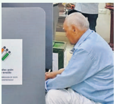
ఇంట్లో ఓటు వేస్తున్న వ్యక్తుడు