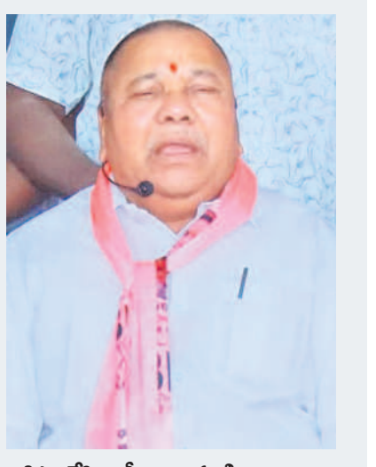
ఓటు వేసి ఆశీర్వదించండి..