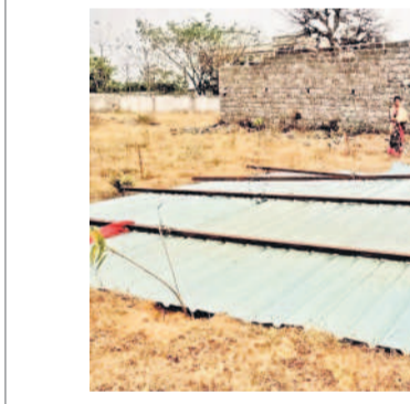
బుధరావుపేటలో గాలి దుమారానికి తడిసిన ఇంటి రేకులు