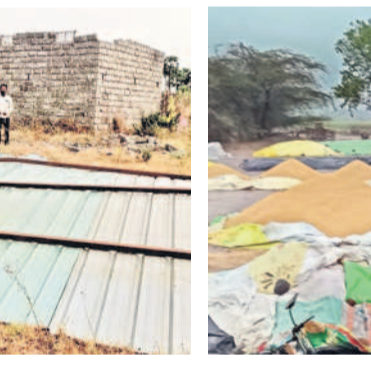
బసవోలు: కొండపల్లి కొనుగోలు కేంద్రంలో తడిసిన పరి ధాన్యం