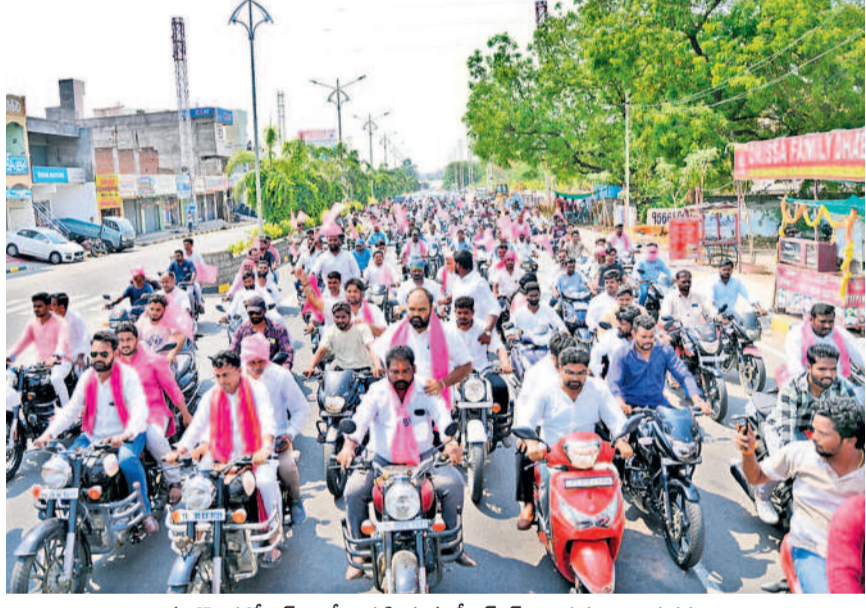
నల్లగొండలో బైక్ రాల్చి నిర్వహిస్తున్న బీఆర్ఎస్ నాయకులు, కార్యకర్తలు

వేసిన నోటిపెట్టెను ఇచ్చి ఉద్యోగాలు ఇచ్చామనడం సిగ్గు చేటు. బీఆర్ఎస్ ఉద్యోగులకు మంచి పీఆర్ఎస్ ఇచ్చింది. కాంగ్రెస్ ఇచ్చిన హామీలు ఎందుకు అవ్వలేదు చేయడం లేదు.