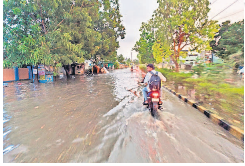
మడికొండలో జలమయమైన ప్రధాన రహదారి

నమస్తే నెట్ వర్క్, మే 7: ఉమ్మడి వరంగల్ జిల్లాను మంగళవారం ఈడురుగాలులు ఆగమోగం చేశాయి. ఉరుములు, మెరుపులతో వర్షం కురిసింది. జయశంకర్ భూపాలపల్లి, ములుగు, హనుమకొండ, వరంగల్, జనగామ జిల్లాల్లో గాలిదుమారం బీభత్సం సృష్టించింది. పలుచోట్ల చెట్లు కూలి, విద్యుత్ స్తంభాలు విరిగిపడ్డాయి. గజపూరి, మహదేవపూర్, పలిమెల మండలాల్లోని కొనుగోలు కేంద్రాల్లో ధాన్యం తడిసి ముద్దయింది. ములుగు, ఏలూరునగరం, మంగలపేట, గోవిందరావుపేట, వెంకటాపూర్, వెంకటాపూర్ మండలాల్లో ధాన్యం రాపిడు తడిసి రైతులు ఇబ్బందులు పడ్డారు. బార్నాలిన్ షేట్ల కమ్మి కాపాడుకునే ప్రయత్నం చేశారు. కమలాపూర్, బసవోలు, శాయపేట, ధర్మసాగర్, దామర, కాజీపేట మండలాల్లో చెట్లు విరిగాయి. వానపూర్, అత్తకూరు, వెన్నారాపుపేట, వర్షస్థపేట మండలాల్లో బలమైన ఈడురుగాలులు పలువురి ఇంటిపై కప్పలు ఎగిరిపడ్డాయి. గ్రేటర్ వరంగల్ లో సుమారు రెండు గంటల పాటు గాలి దుమారం బీభత్సం సృష్టించింది. దీంతో వానానదారులు, బాటసారులు ఇబ్బందులు పడ్డారు. వర్షంతో హనుమకొండ బస్ స్టేషన్ జలమయం కాగా, పలు కాలనీల్లో వరద నీరు వచ్చి చేరింది. ఎన్నికల సేవద్దంలో ఏర్పాటు చేసిన ఫ్లెక్సిలు విరిగిపోగా, చెట్ల కొమ్మలు విరిగి పడ్డాయి. జనగామ, బచ్చస్థపేట, నర్సెట్ల, తరిగిపూల, రఘునాథపల్లి, స్థిప