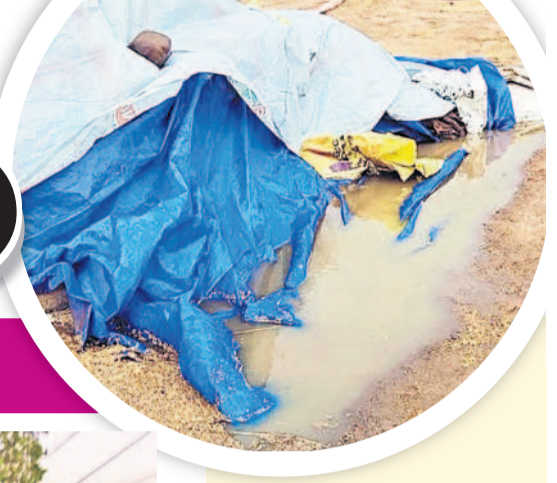
వెంకటాపూర్ (నూగూరు)లో తడిసిన ధాన్యం