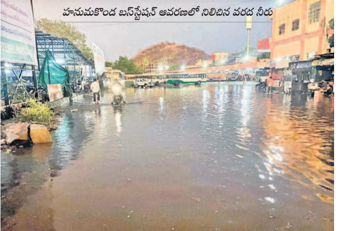
హనుమకొండ బస్ స్టేషన్ ఆవరణలో నిలిచిన వరద నీరు