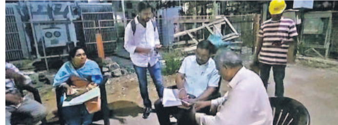
కరెంట్ ఎందుకీస్తారో అంటూ అధికారులను ప్రశ్నిస్తున్న చందానగర్ వాసి

కరెంట్ ఎందుకీస్తారో అంటూ అధికారులను ప్రశ్నిస్తున్న చందానగర్ వాసి ఫరా లేకపోవడంతో మహిళలు, పిల్లలు తీవ్ర ఇబ్బందులు ఎదుర్కొన్నారు. పలు మార్లు ఫిర్యాదులు చేసినా సంబంధిత అధికారులు, సిబ్బంది నిర్లక్ష్యంగా సమాధానాలు చెప్పారు. మరీకొంతమంది అసలు స్పందించలేదు. దీంతో సహనం కోల్పోయి ఆగ్రహానికి లొంగిన చందానగర్ వాసులు సవనీపేట ఎదుట ఉన్న కరెంట్ కోతలపై అధికారులను ప్రశ్నించగా సిబ్బంది సవనీపేట పరిధిలో విద్యుత్ తీగలపై భారీగా చెట్లు విగినీ పడడంతో పాటు 11మీ విద్యుత్ పోల్స్ పడిపోయాయి. దీంతో మంగళవారం సాయంత్రం నుంచి బుధవారం సాయంత్రం వరకు కరెంట్ లేక ప్రజలు తీవ్ర ఇబ్బందులకు గురయ్యారు. 24 గంటలూ కరెంట్ సర