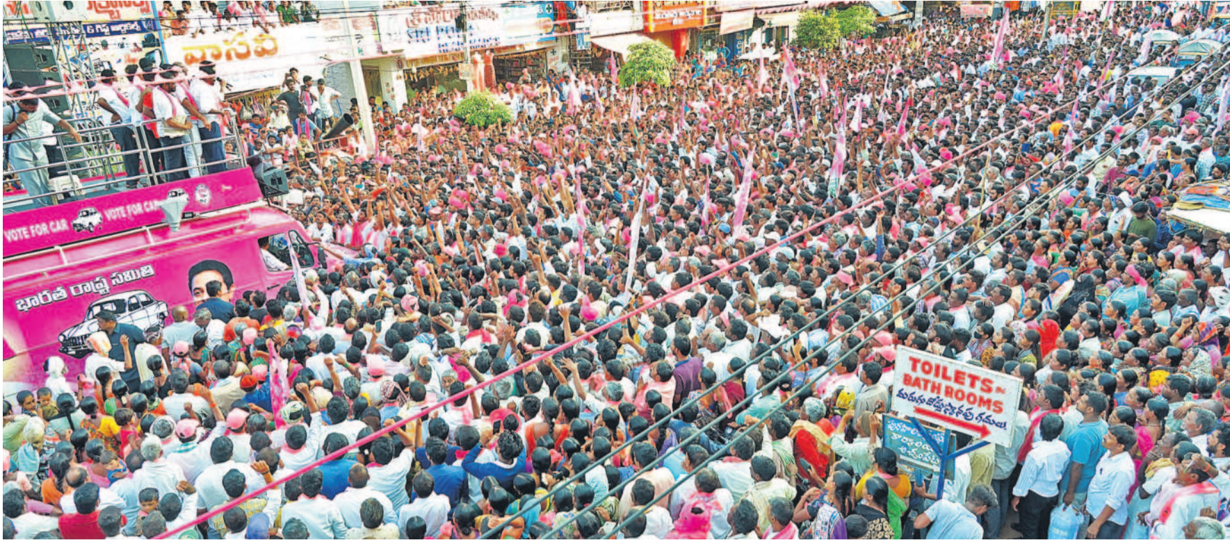
నాగర్ కర్నూల్ జిల్లా అచ్చంపేట రోడ్ షోలో హాజరైన జనం, బీఆర్ఎస్ నాయకులు