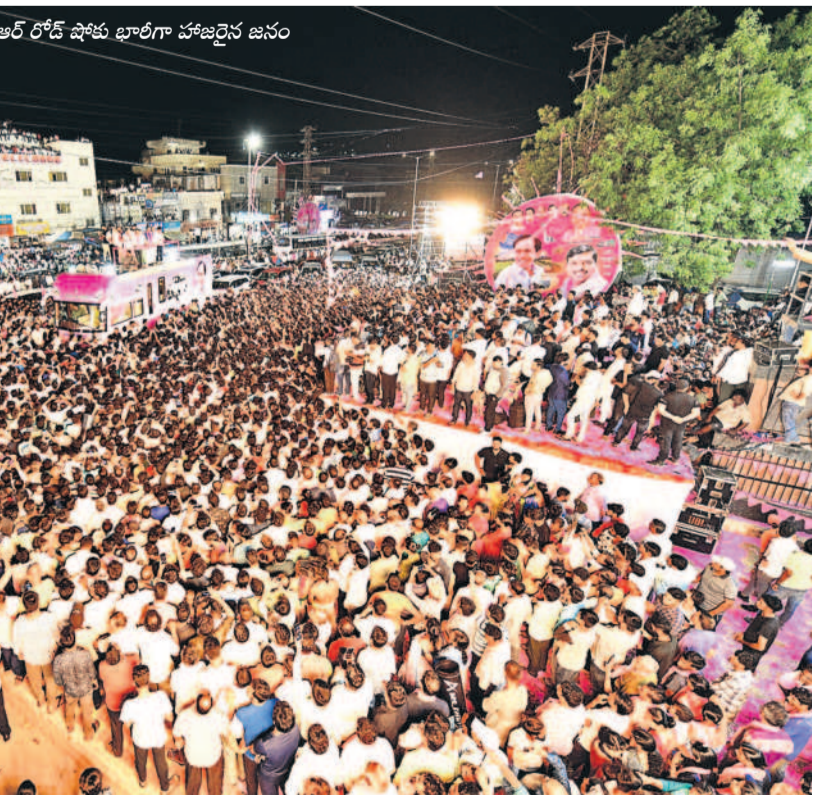
బుధవారం రాత్రి పటాన్చెరులో కేసీఆర్ రోడ్ షోకు భారీగా హాజరైన జనం

ధరలు తగ్గుతున్నాయి. పటాన్చెరు, కొల్లూరు ప్రాంతంలో అపారమెంట్ నిర్మాణం కోసం రేవంత్ రెడ్డి అనుమతులు ఇవ్వకుండా రియల్ ఎస్టేట్ రంగాన్ని ప్రమాదంలోకి నెడుతున్నారని ఆరోపించారు. పల్లెపల్లె కోసం రేవంత్ రెడ్డి స్వీట్స్ బిట్ కు రూ. 75 డిమాండ్ చేస్తున్నారని తెలిపారు. కరోలు కోతలతో పరిశ్రమలు తరలిపోతున్నట్లు తెలిపారు. బిత్తంలో ప్రభుత్వం తీసుకువచ్చిన టీఎన్ఎఫ్ వల్ల పటాన్చెరు ప్రాంతంలో పెద్ద ఎత్తున పరిశ్రమలు ఏర్పాటు అవుతున్నట్లు తెలిపారు. నిరంతరం కరోలు సరఫరా చేయడంతో పారిశ్రామికవేత్తలు సంగారెడ్డి జిల్లాలో కేసీఆర్ ప్రసంగిస్తూ చేపట్టిన సర్కారుని తెలిపారు. రేపంత్ ప్రభుత్వం కారణంగా పటాన్చెరులో రియల్ ఎస్టేట్ కుప్పకూలిందని, భూముల