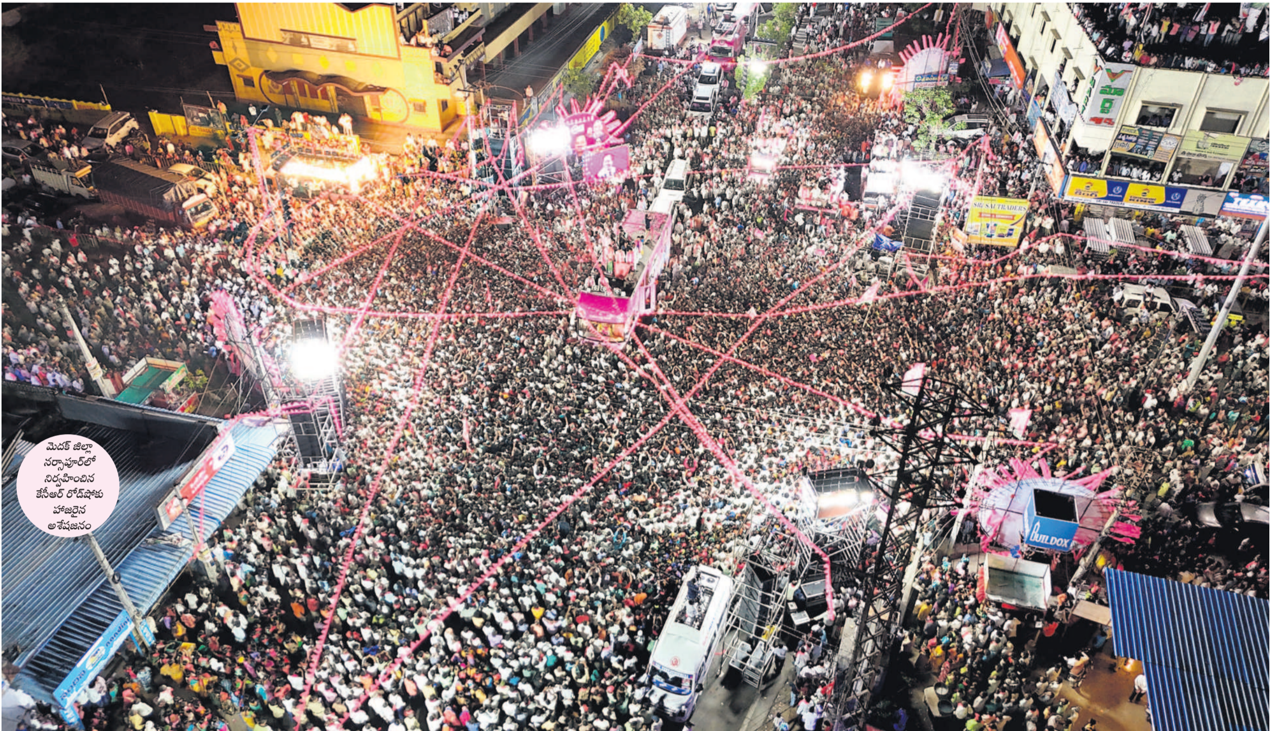
మెడక్ జిల్లా సర్కారులో నిర్వహించిన కేసీఆర్ రోడ్ షోకు హాజరైన అశేషజనం