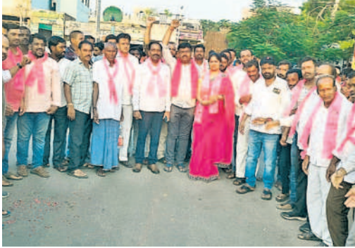
కేసీఆర్ కు సాగిన పలుకుతున్న బీఆర్ఎస్ నాయకులు

నర్సాపూర్/శివ్వంపేట, మే 8: పార్లమెంట్ ఎన్నికల సందర్భంగా బుధవారం నర్సాపూర్లో కేసీఆర్ నిర్వహించిన బస్సు యాత్ర