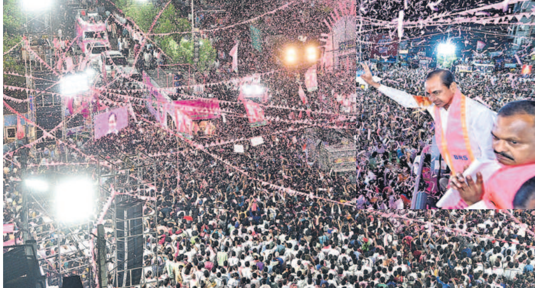
నర్సాపూర్లో జరిగిన రోడ్ షోలో ప్రజలకు అభివృద్ధి చెప్పిన కేసీఆర్