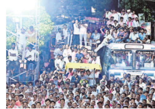
ఆర్డీసీ బస్సుపై కుర్మాణ్ కేసీఆర్ ప్రసంగం వింటున్న ప్రజలు