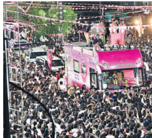
నర్సాపూర్లో నిర్వహించిన రోడ్ షోలో తరలివచ్చిన అశోష జనం