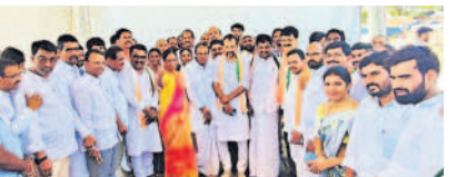
రాహుల్ సభ ఏర్పాటు పరిశీలిస్తున్న మంత్రి సురేఖ

నర్సాపూర్, మే 8: నర్సాపూర్కు కాంగ్రెస్ అ గ్రీనాయకుడు రాహుల్ గాంధీ గురువారం రానున్నారు.