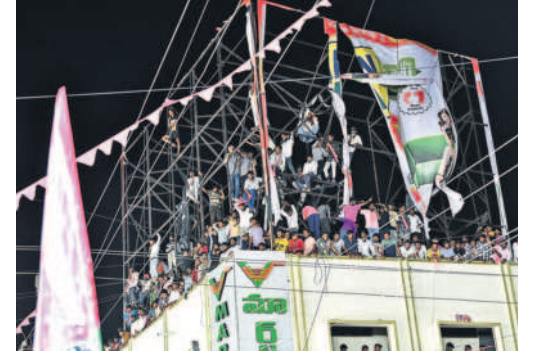
చౌరనూ వద్ద భవనంపై ఉన్న హోర్నింగ్ పైకి ఎక్కిన ప్రజలు