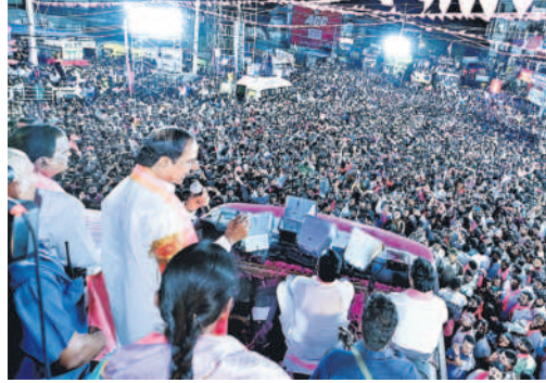
నర్సాపూర్లో మాట్లాడుతున్న గులాబీ బాస్ కేసీఆర్

మెడక్ అర్బన్, మే 8: ప్రజాస్వామ్యంలో అన్నికల ప్రక్రియ చాలా కీలకమైందని, వ్యతిరేక చర్యలకు