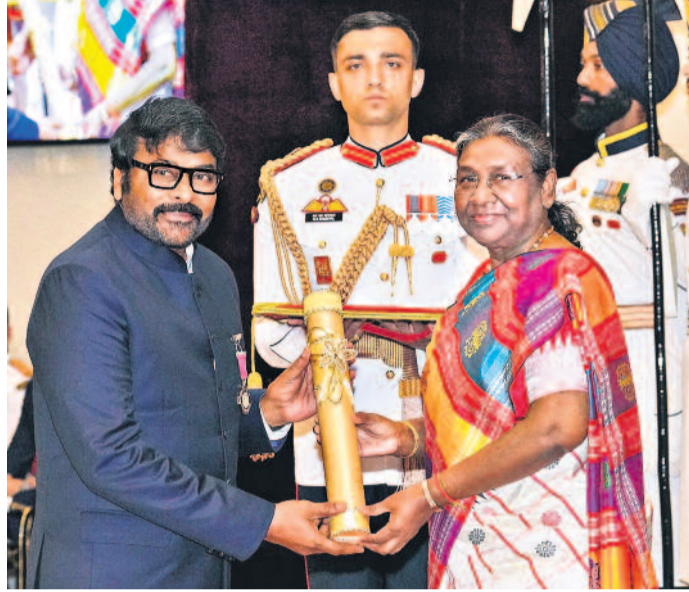
డిల్లీలోని రాష్ట్రపతి భవన్లో గురువారం సాయంత్రం జరిగిన కార్యక్రమంలో రాష్ట్రపతి ద్రౌపది ముర్ము చేతుల మీదుగా పద్మభిషావక పురస్కారాన్ని అందుకుంటున్న ప్రముఖ నటుడు చిరంజీవి, పద్మశ్రీ పురస్కారాన్ని అందుకుంటున్న సాహితీవేత్త కూరకొండ విఠలాచార్య