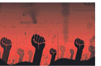
బీజేపీ ఏకంగా తినే చేతులనే తెగనరికిన చందంగా వ్యవహరిస్తున్నదనే ఆవేదన వారిలో వ్యక్తమవుతున్నది.

హైదరాబాద్, మే 9 (నమస్తే తెలంగాణ): రాష్ట్రంలోని బడుగులు పిడికిలికారా? కాంగ్రెస్, బీజేపీలపై బీసీలు తిరుగుబాటు జెండా ఎత్తారా? అంటే జరుగుతున్న పరిణామాలు అవుననే అంటున్నాయి. ప్రాంతీయ పార్టీల ద్వారా తమ హక్కులు సాధించుకున్న బీసీలు.. ఈసారి పార్లమెంట్ ఎన్నికల్లో ప్రాంతీయ పార్టీలకే అండగా నిలుస్తున్న దృక్పథాలు దేశవ్యాప్తంగా కనిపిస్తున్నాయని, తెలంగాణలోనూ ఇదే డోరజే ఉన్నదని సామాజిక పరిశీలకులు విశ్లేషిస్తున్నారు. సాధించిన కున్న హక్కులను కాపాడుకోవడం బీఆర్ఎస్ తోనే సాధ్యమవుతుందన్న భావన బలహీనవర్గాల్లో బలంగా వ్యక్తమవుతున్నదని చెప్పి న్నారు. కాంగ్రెస్, బీజేపీలు కేవలం ఎన్నికల సమయంలోనే బీసీ రిజర్వేషన్లు, కులగణన తదితర అంశాలను తెరమీదికి తెచ్చి ఓట్లు వేస్తూ అన్న రితిలో కాంగ్రెస్, బీజేపీలు రాష్ట్ర రాజకీయం తమదంటూ మాత్రమే తిరిగి వేసుకోవడానికి ప్రయత్నించాయి. అయితే కేసీఆర్ బస్సుయాత పేరుతో ప్రజల్లోకి రావడంతో వాటివత్తుగ డలు విఫలమయ్యాయి.