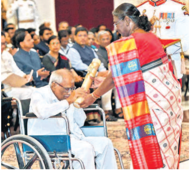
డిల్లీలోని రాష్ట్రపతి భవన్లో గురువారం సాయంత్రం జరిగిన కార్యక్రమంలో రాష్ట్రపతి ద్రౌపది ముర్ము చేతుల మీదుగా పద్మభిషావక పురస్కారాన్ని అందుకుంటున్న సాహితీవేత్త కూరకొండ విఠలాచార్య