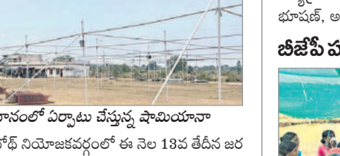
కళాశాల మైదానంలో ఏర్పాటు చేస్తున్న షామియానా

బోధ్, మే 10: బోధ్ నియోజకవర్గంలో ఈ నెల 13వ తేదీన జరగనున్న ఆదిలాబాద్ పార్లమెంట్ ఎన్నికల పోలింగ్ కోసం అధికారులు ముమ్మరంగా ఏర్పాట్లు చేస్తున్నారు. ఎన్నికల రిటర్నింగ్ అధికారి, ఇటీవల పీవో బుమ్మగూడు అభ్యర్థుల పోలింగ్ విధులు కోసం వచ్చే అధికారులు, సిబ్బందికి ఏర్పాట్లు చేస్తున్నారు. నియోజకవర్గం పరిధిలోని 9 మండలాలను 35 టూల్ గా విభజించారు. ఏపీ, పీఐ, కర్నల్ సిబ్బంది సుమారు 1,560 మందిని ఇప్పటికే విధుల కోసం నియమించారు. మొత్తం 2 లక్షల 11 వేల 300 మంది ఓటుర్లు తమ ఓటు హక్కు వినియోగించుకునేలా పోలింగ్ కేంద్రాల్లో అవసరమైన ఏర్పాట్లు చేస్తున్నారు.