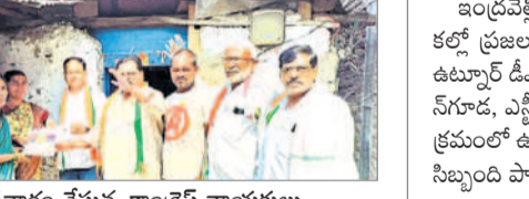
బోధ్: ప్రచారం చేస్తున్న కాంగ్రెస్ నాయకులు