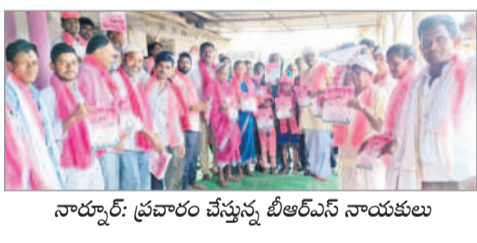
నార్నూర్: ప్రచారం చేస్తున్న బీఆర్ఎస్ నాయకులు

ఇప్పటిలో, మే 10: మండల కేంద్రంలో బీఆర్ఎస్ నాయకులు ఇంటింటా ప్రచారం నిర్వహించారు. కార్యక్రమంలో మండల