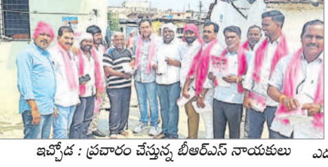
ఇప్పటి: ప్రచారం చేస్తున్న బీఆర్ఎస్ నాయకులు