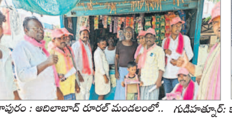
ఎదులాపురం: ఆదిలాబాద్ రూరల్ మండలంలో.. గుడిహత్వార్: కారు గుర్తుకు ఓటు వేయాలని ప్రచారం చేస్తున్న నాయకులు