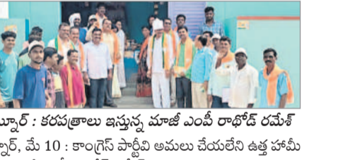
ఉట్నూర్: కరవత్రం ఇప్పుడు మాజీ ఎంపీ రాజ్ రమేష్

ఉట్నూర్, మే 10: కాంగ్రెస్ పార్టీని అమలు చేయలేని ఉత్త హామీ లేనని మాజీ ఎంపీ రాజ్ రమేష్ అన్నారు. శుక్రవారం మండల కేంద్రంలోని శాంతినగర్ లో పాటు పలు కాలనీల్లో ప్రచారం నిర్వహించారు. కార్యక్రమంలో నాయకులు రమేష్, రాజేశ్వర్, శేఖర్, ఉపేందర్, అశ్వు పాల్గొన్నారు.