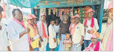
ఎదులాపురం: ఆదిలాబాద్ రూరల్ మండలంలో.. గుడిహత్వార్: కారు గుర్తుకు ఓటు వేయాలని ప్రచారం చేస్తున్న నాయకులు