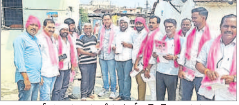
ఇప్పటి: ప్రచారం చేస్తున్న బీఆర్ఎస్ నాయకులు