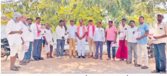
ధారూరు మండలంలోని హరిదాస్ పల్లిలో..