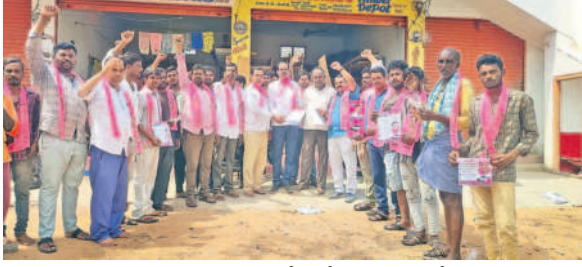
యాలాల మండలంలోని కోకట్ గ్రామంలో...