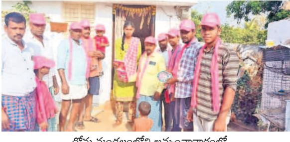
దోమ మండలంలోని ఖమ్మంనాచారంలో..