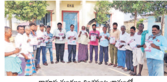
ధారూరు మండలం వింతకుండా గ్రామంలో..