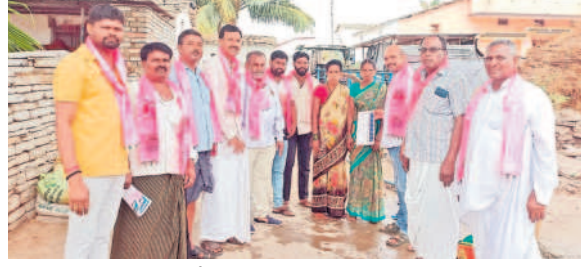
బిషరాబాద్ మండలం జీవనల్లో..