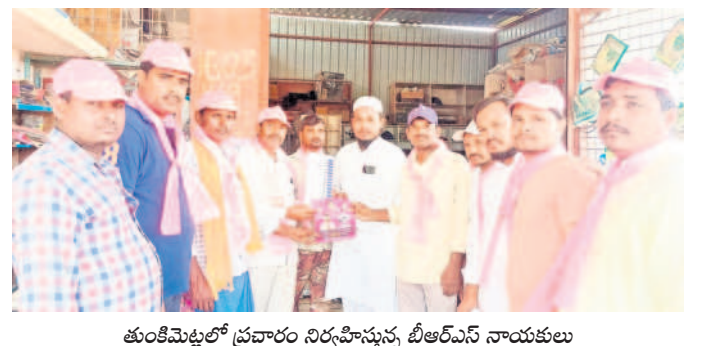
తుంకిమెల్లో ప్రచారం నిర్వహిస్తున్న బీఆర్ఎస్ నాయకులు