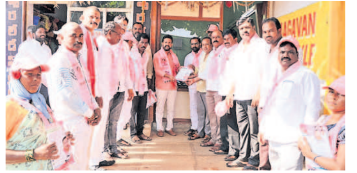
ఇంటింటి ప్రచారం చేస్తున్న మాజీ ఎమ్మెల్యే మెతుకు ఆనంద్, బీఆర్ఎస్ నాయకులు