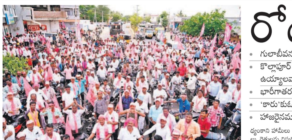
నాగర్ కర్నూల్ జిల్లా కేంద్రంలో టైటిల్ డివిజన్ బీఆర్ఎస్ శ్రేణులు, ప్రజలు

మహబూబ్ నగర్, మే 11 (నమస్తే తెలంగాణ ప్రతినది) : ఉమ్మడి మహబూబ్ నగర్ జిల్లాలో పార్లమెంట్ ఎన్నికల ప్రచారానికి తెర పడింది. కాగా ఎన్నికల కాలం దేశం పురా అయ్యింది. మరో 24 గంటల్లో ఎంపీ ఎన్నికలు జరుగుతున్నాయి. ప్రజల అభివృద్ధి కోసం ప్రజాపాలనను పునరుద్ధరించాలని ఆయన కోరారు. ప్రజల అభివృద్ధి కోసం ప్రజాపాలనను పునరుద్ధరించాలని ఆయన కోరారు. ప్రజల అభివృద్ధి కోసం ప్రజాపాలనను పునరుద్ధరించాలని ఆయన కోరారు.