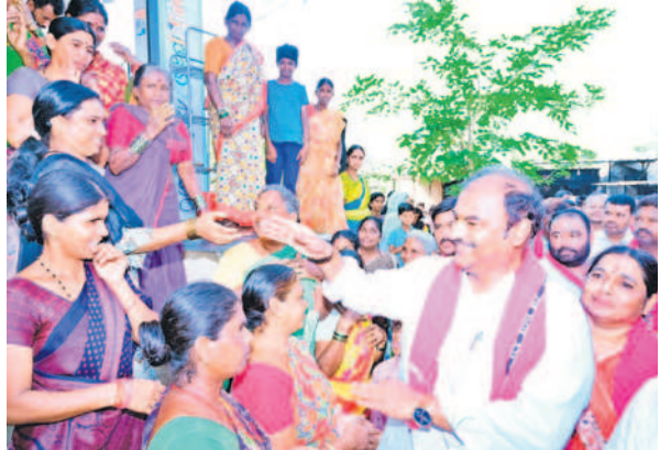
ప్రచారంలో భాగంగా మహిళలతో కరచాలనం చేస్తున్న ఎమ్మెల్యే బండ్ర